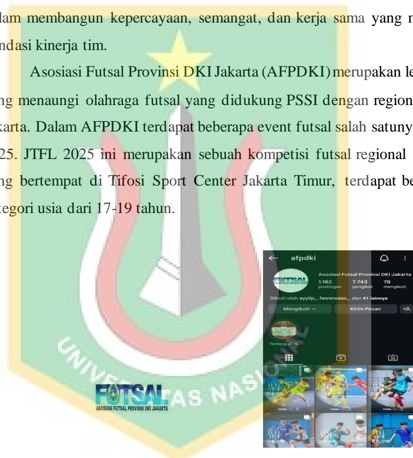
Gambar 1.1 Logo dan Instagram AFPDKI

Asosiasi Futsal Provinsi DKI Jakarta (AFPDKI) merupakan lembaga yang menaungi olahraga futsal yang didukung PSSI dengan regional DKI Jakarta. Dalam AFPDKI terdapat beberapa event futsal salah satunya JTFL 2025. JTFL 2025 ini merupakan sebuah kompetisi futsal regional Jakarta yang bertempat di Tifosi Sport Center Jakarta Timur, terdapat beberapa kategori usia dari 17-19 tahun.