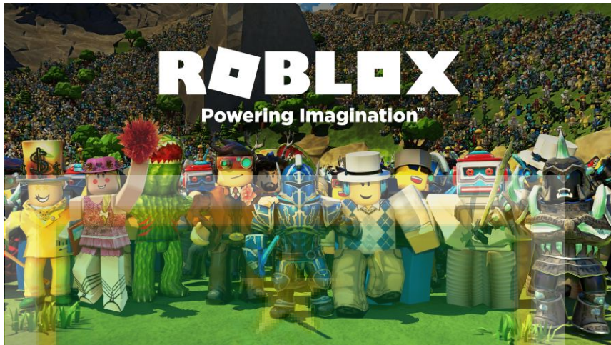
Gambar 1.1 Profil Platform Game Roblox

berbagai peran dengan pemain lain. Karakteristik ini menjadikan Roblox bukan hanya tempat hiburan, tetapi juga ruang sosial yang aktif dan kreatif.