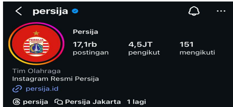
Gambar 1. 2 Akun Instagram @Persija