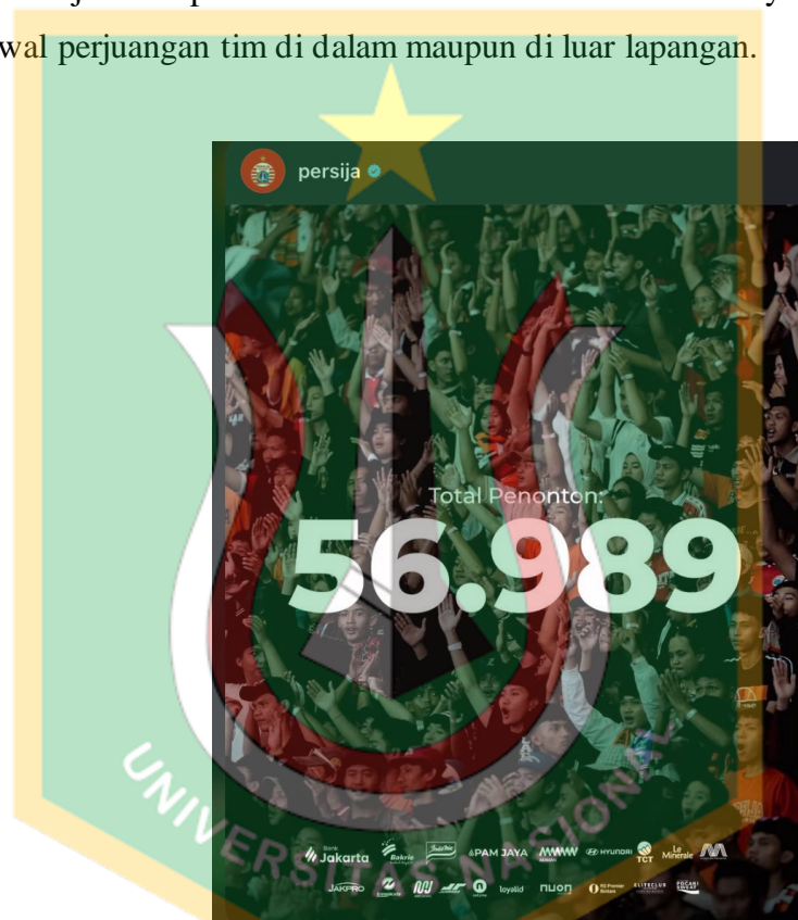
Gambar 1. 1 Total Supporter

Lautan manusia memenuhi tribun stadion, menyatu dalam satu suara dan satu tujuan mendukung Persija tanpa syarat. Angka 56.989 penonton bukan sekadar statistik kehadiran, melainkan bukti nyata militansi dan loyalitas suporter yang terus hidup dari generasi ke generasi. Gelombang tangan yang terangkat serentak memenuhi tribun stadion dan teriakan yang menggema, tersimpan semangat kebersamaan, solidaritas, dan rasa memiliki yang kuat terhadap klub kebanggaan ibu kota. Kehadiran ribuan suporter ini menunjukkan bahwa Persija tidak pernah berdiri sendiri ada The Jakmania yang selalu setia, mengawal perjuangan tim di dalam maupun di luar lapangan.