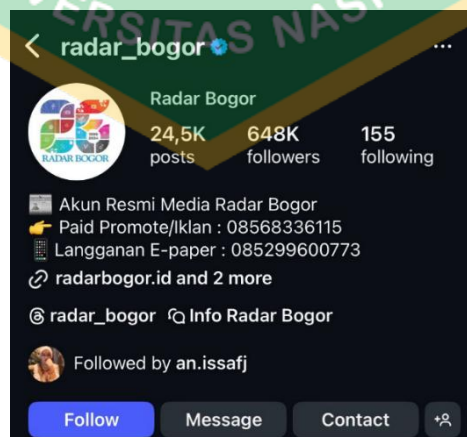
Gambar 1.2 Akun Instagram @radar_bogor

Radar Bogor juga memperluas jangkauan informasinya melalui platform Instagram. Langkah ini merupakan bagian dari upaya adaptasi media massa dalam menjangkau audiens yang semakin mengandalkan media sosial sebagai sumber informasi utama. Di antara berbagai kanal digital tersebut, Instagram @radar_bogor menjadi salah satu medium yang aktif digunakan untuk menyebarkan informasi secara cepat dan visual. Selain mengunggah konten dari tim redaksi, akun ini juga kerap mempublikasikan kiriman video atau foto dari warga setempat yang berada di lokasi kejadian, menandai adanya praktik Citizen Journalism dalam strategi pemberitaan mereka.