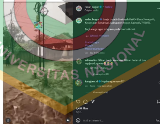
Gambar 1.3 Postingan Instagram @radar_bogor

Berdasarkan pengamatan pola unggahan, konten yang berasal dari Citizen journalism biasanya diberi penanda berupa tulisan “Video: Kiriman warga” atau keterangan serupa pada bagian akhir caption. Selain itu, beberapa kiriman dari platform lain seperti TikTok dicantumkan dengan jelas melalui kredit “Video: Tiktok/@usernamepengirim”, sehingga sumber asli tetap terlihat. Sementara itu, unggahan yang diproduksi oleh tim redaksi atau reporter umumnya diberi identitas jelas seperti “Video: radar Bogor” atau “Video: (nama reporter)”. Dengan adanya penandaan tersebut, audiens dapat membedakan dengan mudah apakah sebuah unggahan merupakan laporan warga, konten dari media sosial lain, atau hasil liputan resmi tim redaksi. Temuan ini menunjukkan bahwa pengelolaan konten merupakan hasil kolaborasi antara partisipasi publik dan kerja redaksional. Dengan demikian akun Instagram @radar_bogor tidak sepenuhnya bergantung pada citizen journalism, melainkan tetap menjalankan fungsi redaksi sebagai bagian dari praktik konvergensi media.