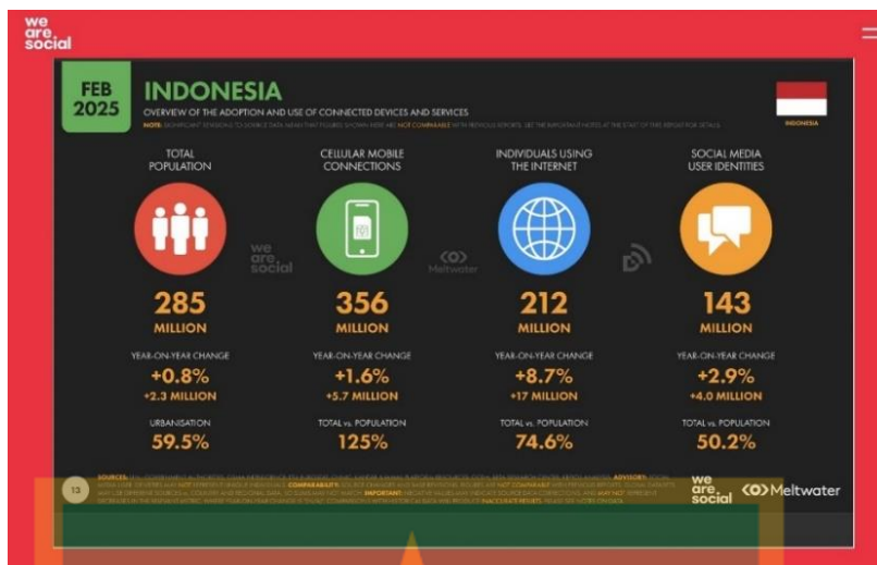
Gambar 1.4 jumlah pengguna internet & pengguna aktif media social.