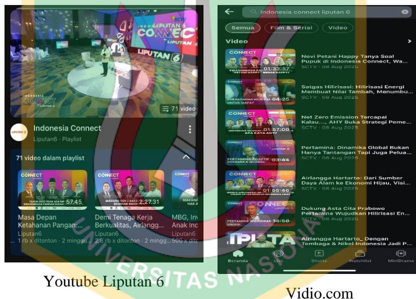
Youtube Liputan 6

Sebagai salah satu program berita unggulan SCTV, Liputan 6 dikenal sebagai program yang menekankan akurasi dan kredibilitas informasi. Liputan 6 hadir dalam berbagai segmen waktu seperti Liputan 6 Pagi, Siang, Petang, dan Malam. Seiring dengan perkembangan digital, Liputan 6 tidak hanya hadir dalam bentuk siaran televisi, tetapi juga melalui platform digital seperti Liputan6.com, YouTube, dan Vidio.com. Menariknya, meskipun Indonesia Connect by liputan 6 merupakan program yang relatif baru dan ditayangkan melalui platform digital, tingkat keterlibatan audiens menunjukkan tren yang positif. Berdasarkan pada tayangan di youtube & Vidio.com.