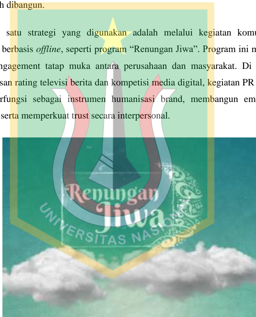
Gambar 1.1 Tampilan Visual Program “Renungan Jiwa”

Salah satu strategi yang digunakan adalah melalui kegiatan komunikasi langsung berbasis offline , seperti program “Renungan Jiwa”. Program ini menjadi sarana engagement tatap muka antara perusahaan dan masyarakat. Di tengah keterbatasan rating televisi berita dan kompetisi media digital, kegiatan PR offline dapat berfungsi sebagai instrumen humanisasi brand, membangun emotional bonding, serta memperkuat trust secara interpersonal.