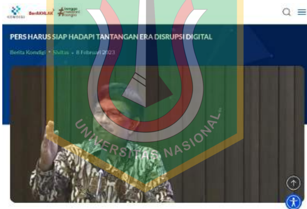
Gambar 1.1 Tantangan Disrupsi Digital terhadap Industri Pers

Perkembangan teknologi komunikasi dan media digital dalam dua dekade terakhir telah mengubah lanskap industri penyiaran di Indonesia. Kemajuan internet, media sosial, dan berbagai platform berbasis digital memungkinkan masyarakat mengakses informasi secara cepat, luas, dan interaktif. Perubahan ini telah mendorong pergeseran pola konsumsi media, di mana televisi tidak lagi menjadi satu-satunya sumber utama informasi. Kondisi tersebut menjadikan media harus bersaing dengan platform digital yang menawarkan fleksibilitas dan personalisasi konten.