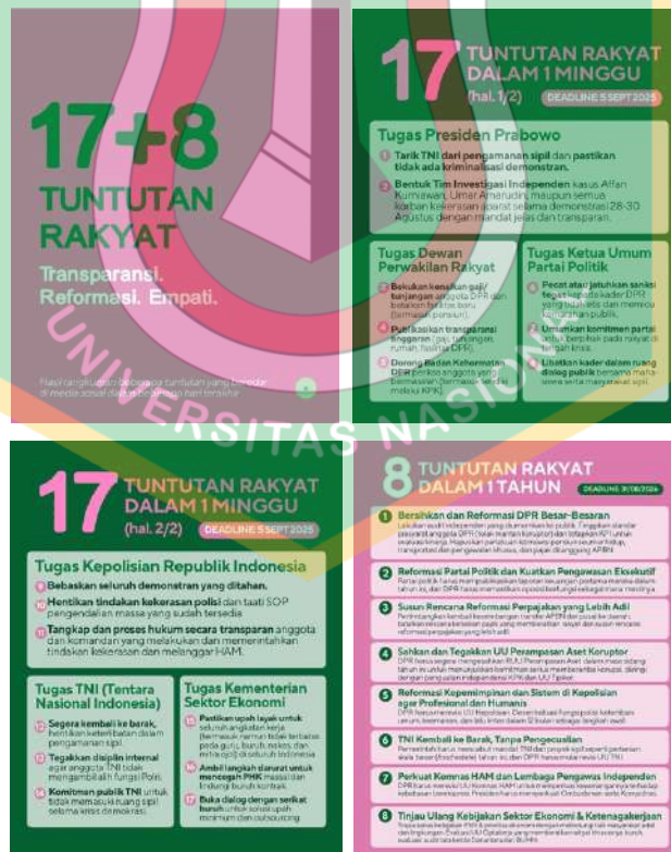
Gambar 1. 1Flyer "17+8 TUNTUTAN RAKYAT"

Sejak akhir Agustus 2025, unggahan visual berjudul “17+8 Tuntutan Rakyat” menjadi fenomena viral di media sosial, khususnya platform X, yang kemudian berkembang menjadi simbol perlawanan kolektif terhadap praktik kekuasaan yang dianggap tidak berpihak pada masyarakat luas. Flyer tersebut memuat rangkaian tuntutan masyarakat terhadap pemerintah, DPR, aparat penegak hukum, dan lembaga negara lainnya, dengan pembagian temporal yang sistematis: 17 tuntutan mendesak dengan batas waktu satu minggu (5 September 2025) dan 8 tuntutan jangka panjang dengan tenggat satu tahun (31 Agustus 2026). Struktur waktu yang jelas ini menunjukkan bahwa flyer tidak sekadar menyampaikan aspirasi, melainkan menyusun kerangka tekanan politik yang terukur dan terorganisir.