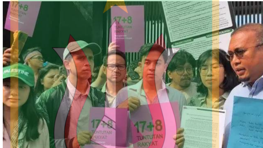
Gambar 1. 5 Apa itu tuntutan 17+8?

Kemunculan flyer "17+8 Tuntutan Rakyat" tidak dapat dipisahkan dari konteks sosial-politik Indonesia tahun 2025. Pada periode Agustus - September 2025, Indonesia mengalami gelombang demonstrasi besar-besaran yang ditujukan kepada Dewan Perwakilan Rakyat dan Pemerintah. Demonstrasi ini dipicu oleh serangkaian kebijakan kontroversial yang dianggap tidak berpihak pada kepentingan rakyat, termasuk rencana revisi Undang-Undang yang dinilai mengancam demokrasi dan kebebasan sipil.