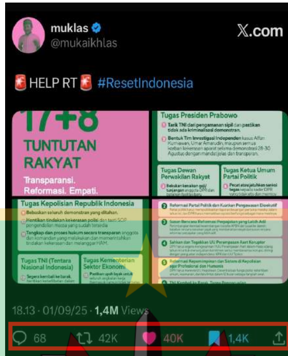
Gambar 1. 2 Bukti penyebaran pada akun X @mukaikhlas

Pada flyer “17+8 TUNTUTAN RAKYAT”, yang di posting oleh @mukaikhlas di media sosial X yang mendapatkan reaksi tayangan 1,4 juta kali, disukai 40 ribu kali dan diposting ulang sebanyak 42 ribu kali. Flyer digital tersebut berisikan tentang apa saja tuntutan rakyat terhadap pemerintah. Dengan format carousel yang memuat 17 tuntutan dalam waktu seminggu dan 8 tuntutan dalam waktu 1 tahun dari masyarakat kepada pemerintah, disertai dengan ajakan moral untuk mewujudkan transparansi, empati, dan reformasi. Penggunaan warna merah muda dan hijau juga melekat pada flyer digital tersebut.