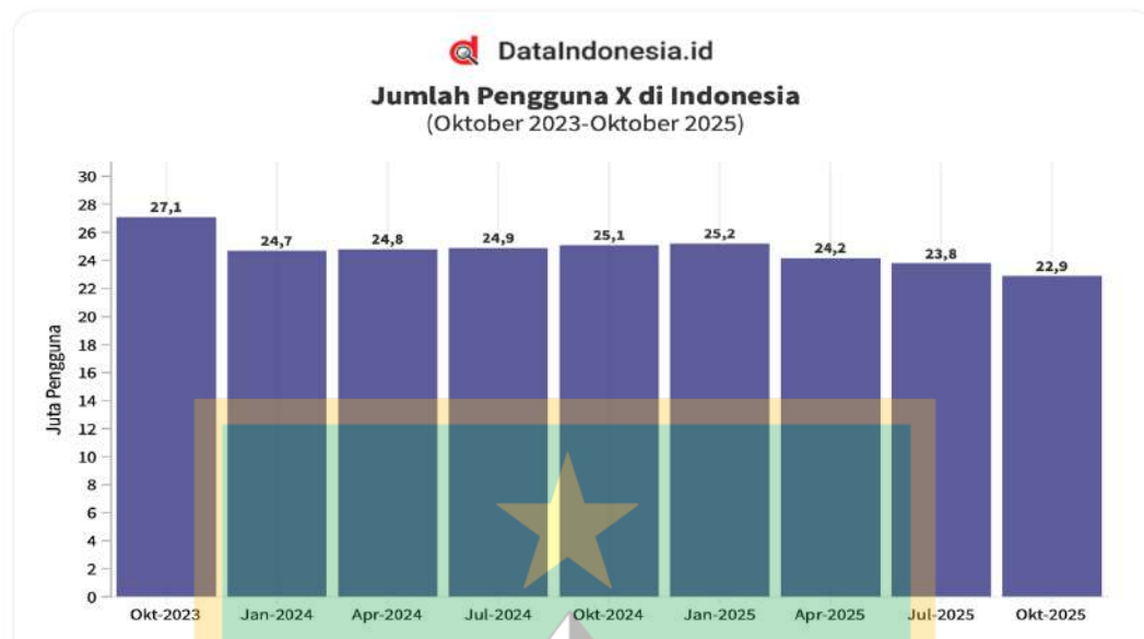
Gambar 1. 3 Jumlah Pengguna X di Indonesia (Visualisasi oleh: Monavia Ayu Rizaty)

Data dari DataIndonesia.id menunjukkan bahwa pada Oktober 2025, pengguna X di Indonesia mencapai 22,9 juta pengguna meskipun mengalami penurunan dari puncaknya di Oktober 2023 (27,1 juta pengguna), X tetap menjadi platform yang signifikan untuk penyebaran konten politik. Media sosial seperti X memiliki karakteristik yang mempercepat penyebaran komunikasi visual jenis ini. Fitur retweet memungkinkan pesan secara eksponensial satu flyer yang awalnya hanya dilihat puluhan orang bisa mencapai jutaan orang dalam hitungan jam jika kontennya menarik dengan sentimen publik. Algoritma timeline yang memprioritaskan konten dengan engagement tinggi membuat konten viral semakin viral. Budaya partisipatif di mana pengguna tidak hanya mengonsumsi tetapi juga menyebarkan, memodifikasi, dan merespons konten menciptakan ekosistem komunikasi yang dinamis dan sulit dikontrol oleh kekuasaan.