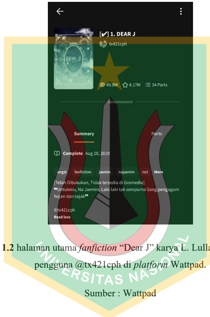
Gambar 1.2 halaman utama fanfiction “Dear J” karya L. Lullaby dengan nama pengguna @tx421cph di platform Wattpad.

sepenuhnya terekspos dalam representasi resmi yang dibangun oleh industri hiburan dan media arus utama. Representasi tersebut menghadirkan versi alternatif Na Jaemin yang lebih intim, reflektif, dan manusiawi, sehingga memungkinkan pembaca mengalami kedekatan emosional dengan karakter yang ditampilkan dalam cerita.