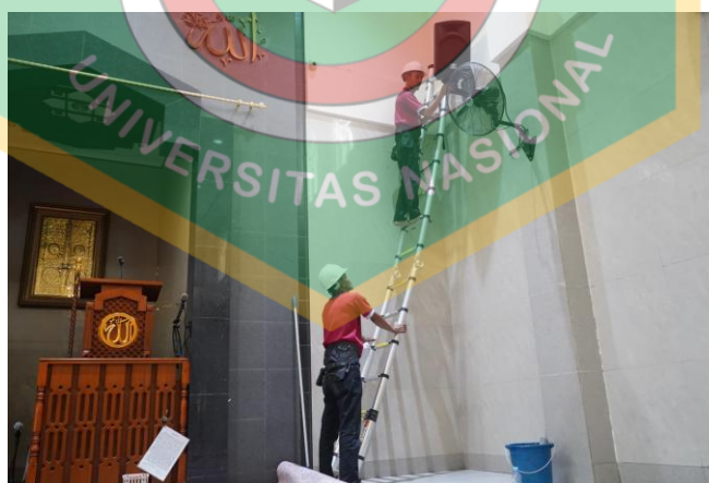
Gambar 1. 2 Kegiatan CSR BIRAWA

Prinsip keberlanjutan yang diformalkan dalam The Way Kanan Programme menegaskan komitmen pada Triple Bottom Line (Nurjanah 2022): sensitivitas lingkungan, dukungan komunitas, dan kinerja keuangan. TelkomProperty menerapkan prinsip ini melalui pengelolaan properti yang ramah lingkungan, layanan yang berfokus pada pelanggan, serta program sosial yang memperkuat hubungan dengan masyarakat, sehingga aktivitas bisnis tetap berkelanjutan sekaligus mendukung kinerja finansial perusahaan.