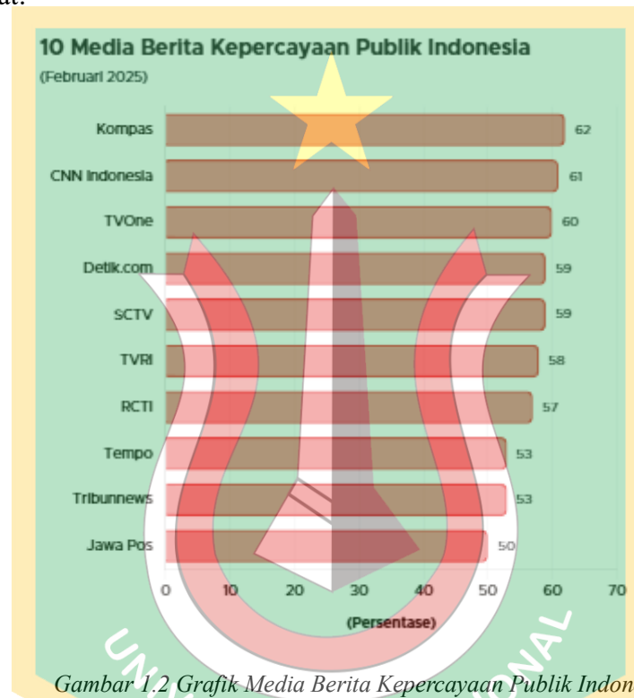
Gambar 1.2 Grafik Media Berita Kepercayaan Publik Indonesia

Dalam konteks pemberitaan kasus keracunan MBG, peran media online semakin menjadi relevan. Merujuk pada publikasi Badan Pusat Statistik (BPS) periode 2024, 72,78 % penduduk Indonesia telah mengakses internet. Statistik tersebut menunjukkan bahwa publik saat ini memiliki lebih banyak kebebasan untuk menjangkau sumber informasi dengan media online. Kini media online menjadi sumber informasi utama bagi masyarakat. Framing yang dibentuk oleh media online juga memiliki dampak signifikan terhadap terbentuknya pandangan masyarakat.