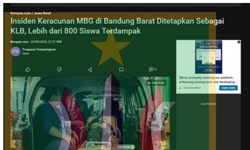
Gambar 1.1 Berita Kompas.com (24 September 2025)

Episentrum Kasus Keracunan MBG, JPPI Catat 4.125 Korban” (Kompas.com, 15 Oktober 2025). Jaringan Pemantau Pendidikan Indonesia (JPPI) mencatat hingga pertengahan Oktober 2025 terdapat 4.125 siswa di Jawa Barat yang terdampak keracunan MBG. Angka tersebut menempatkan Jawa Barat sebagai daerah dengan kasus keracunan MBG terbanyak di Indonesia. Kasus tersebut telah menjadi fokus utama bagi pemerintah daerah dan juga mendapatkan sorotan berbagai media.