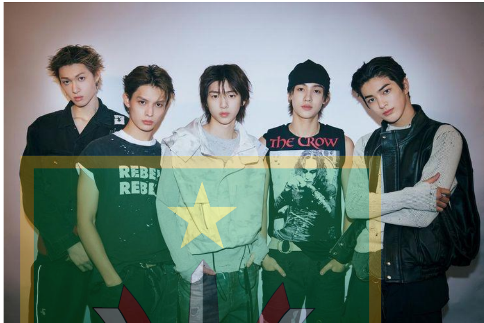
Gambar 1.2 Boy Grup CORTIS

bagian dari fandom melalui akses informasi dan partisipasi berbasis konten, bukan sebagai analisis interaksi atau percakapan antar pengguna.