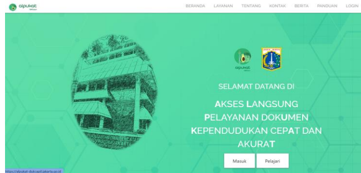
Gambar 1. 1 Aplikasi Alpukat Betawi