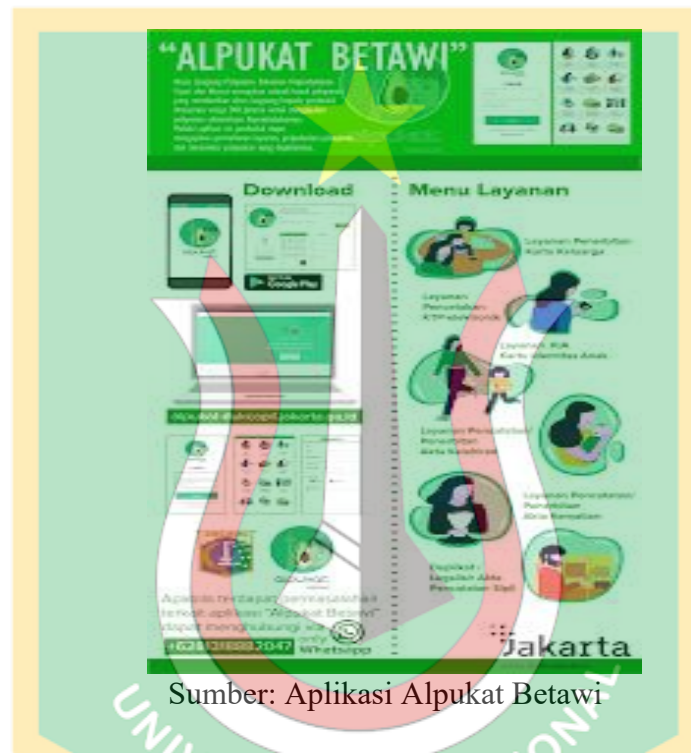
Gambar 1. 2 Menu Layanan Aplikasi Alpukat Betawi

Sebelum dapat memanfaatkan layanan yang tersedia pada aplikasi Alpukat Betawi, pengguna diwajibkan untuk melakukan proses pendaftaran akun terlebih dahulu. Tahap registrasi ini menjadi langkah awal agar masyarakat dapat mengakses berbagai fitur pelayanan administrasi kependudukan secara daring, tahapannya, yaitu: