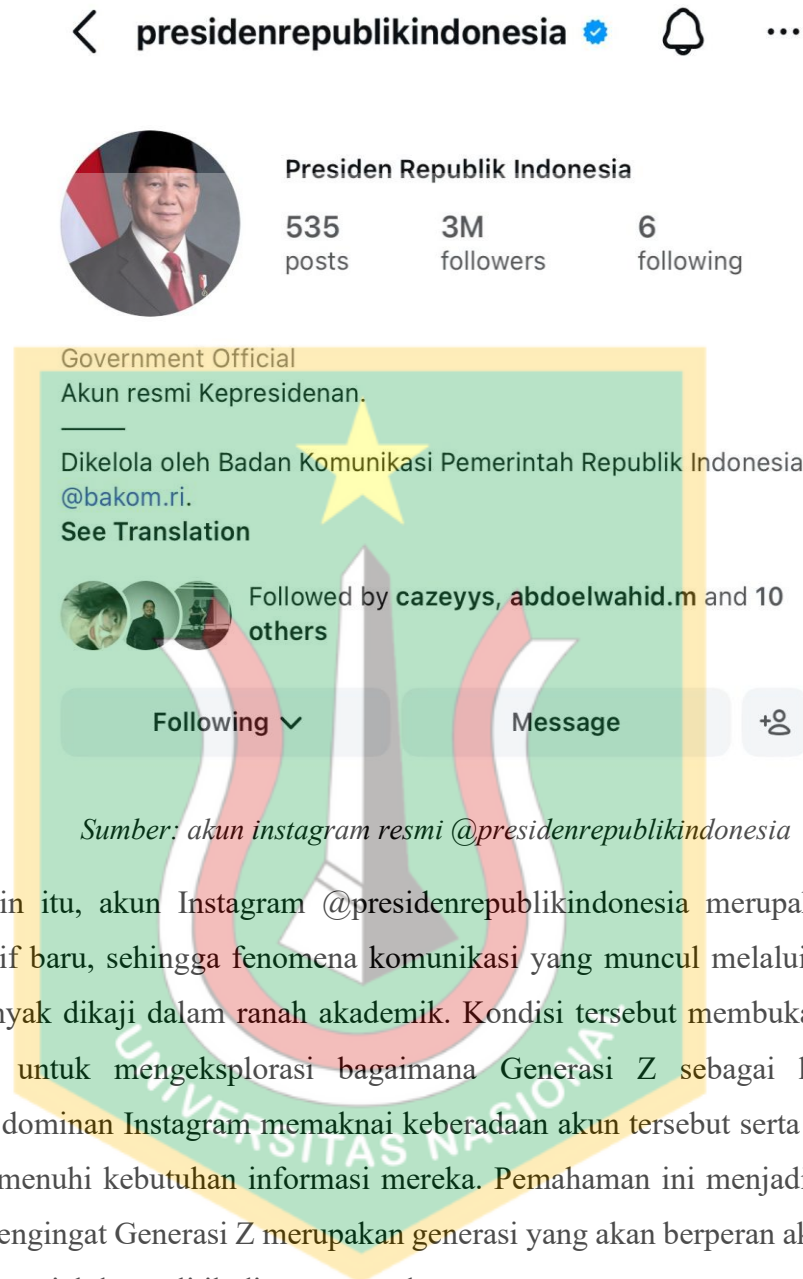
Gambar 1.2 Akun Resmi @presidenrepublikindonesia

Selain itu, akun Instagram @presidenrepublikindonesia merupakan akun yang relatif baru, sehingga fenomena komunikasi yang muncul melalui akun ini belum banyak dikaji dalam ranah akademik. Kondisi tersebut membuka peluang penelitian untuk mengeksplorasi bagaimana Generasi Z sebagai kelompok pengguna dominan Instagram memaknai keberadaan akun tersebut serta perannya dalam memenuhi kebutuhan informasi mereka. Pemahaman ini menjadi semakin penting mengingat Generasi Z merupakan generasi yang akan berperan aktif dalam kehidupan sosial dan politik di masa mendatang.