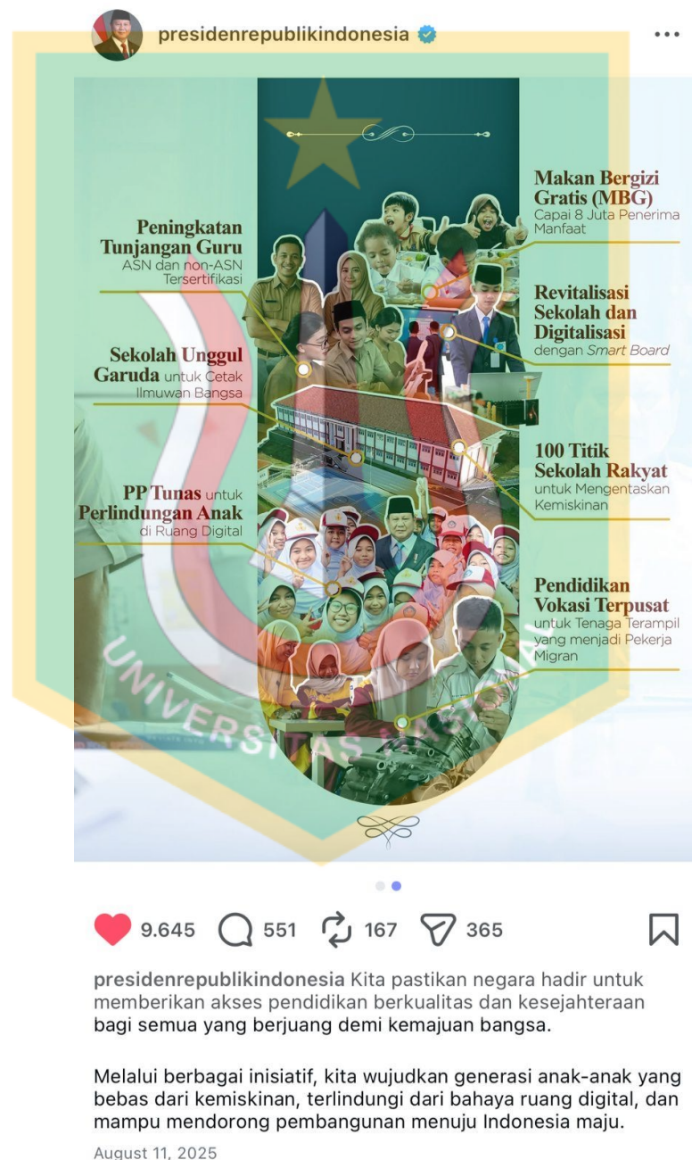
Gambar 1.4 Salah Satu Konten Untuk Membangun Literasi di Akun Resmi @presidenrepublikindonesia