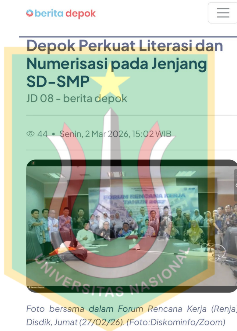
Foto bersama dalam Forum Rencana Kerja (Renja) Disdik, Jumat (27/02/26).