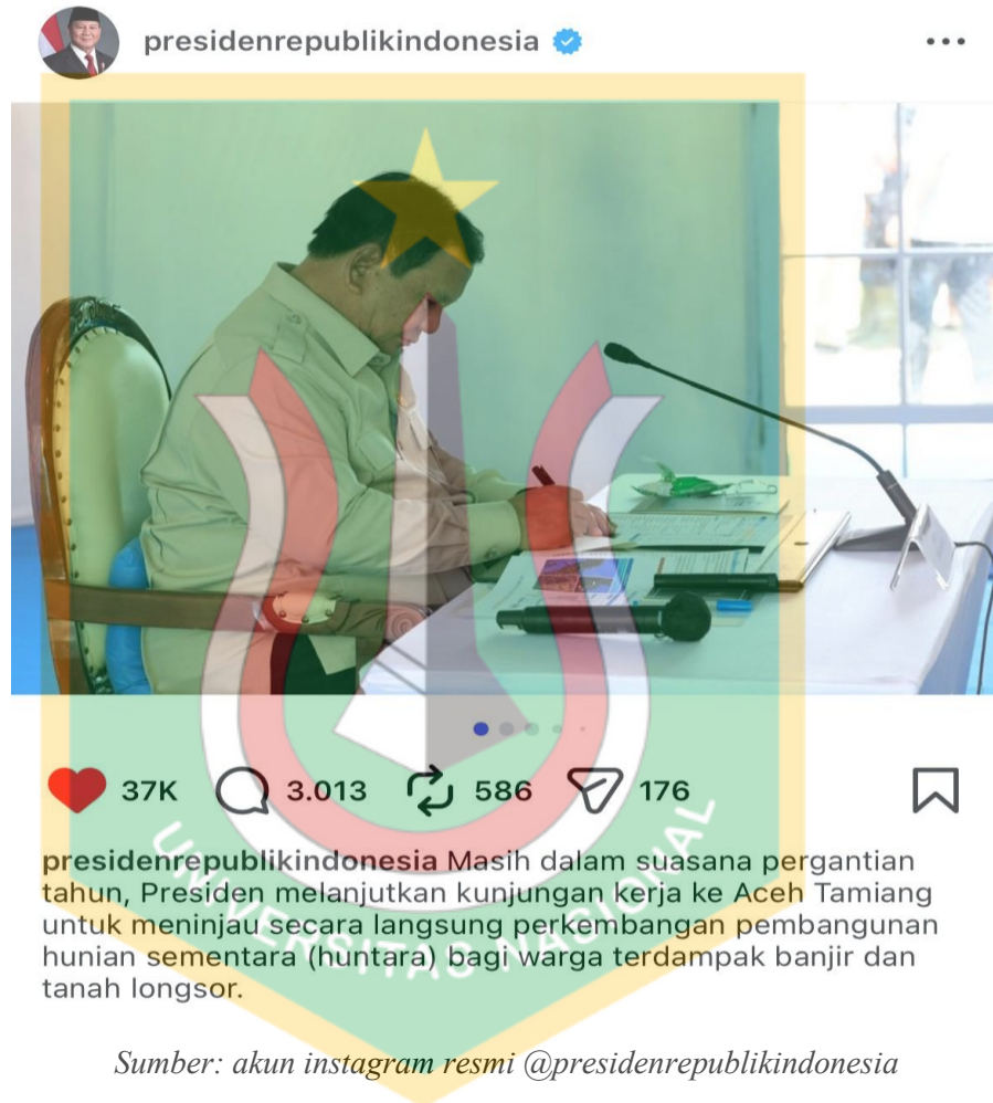
Gambar 1.3 Postingan Akun Resmi @presidenrepublikindonesia

Postingan di akun Instagram @presidenrepublikindonesia berisikan dokumentasi berupa foto atau video kegiatan kepresidenan seperti kunjungan kenegaraan, pertemuan dengan kepala negara lain, kegiatan rapat, dan lain sebagainya, dimana postingan pada akun tersebut memiliki potensi sebagai wadah atau media dalam membangun literasi informasi masyarakat. Akun Instagram @presidenrepublikindonesia rata-rata menyajikan 6 postingan per minggu, dengan jumlah rata-rata like adalah 14,932,2. Postingan di akun Instagram