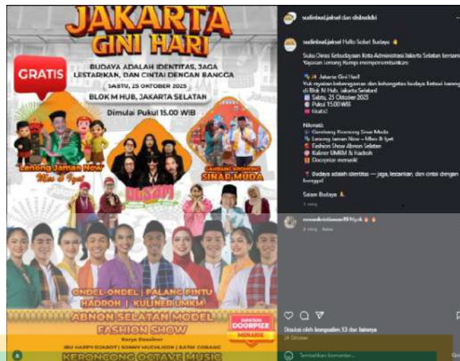
Gambar 1. 3 Postingan Repost & collaboration dengan akun Dinas Kebudayaan DKI Jakarta