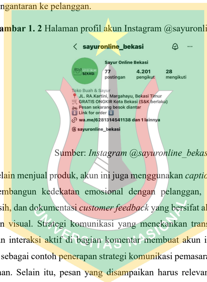
Gambar 1. 2 Halaman profil akun Instagram @sayuronline_bekasi

Akun @sayuronline_bekasi, yang berdiri sejak tahun 2024, merupakan salah satu UMKM di wilayah Bekasi yang berfokus pada penjualan sayur dan bahan dapur segar melalui Instagram. Akun ini memiliki lebih dari 4.000 pengikut aktif (data observasi, 2026) dan secara konsisten mengunggah konten berupa dokumentasi kegiatan belanja di pasar tradisional, proses packaging rumahan, hingga pengantaran ke pelanggan.