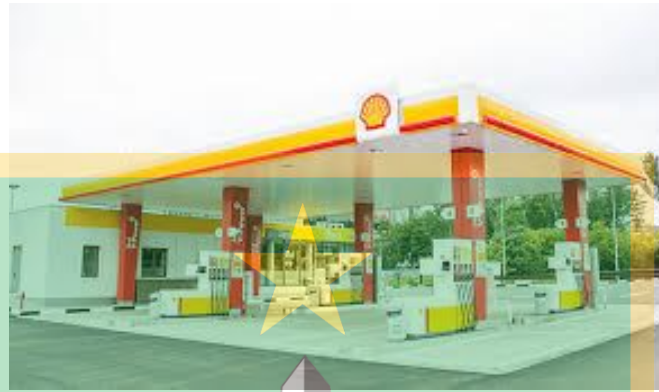
Gambar 1. 1 SPBU Shell

Dalam dunia komunikasi modern, manajemen krisis menjadi salah satu aspek penting dalam menjaga keberlangsungan dan reputasi suatu organisasi. Setiap perusahaan, baik yang bergerak di bidang jasa maupun produksi, berpotensi menghadapi situasi krisis yang dapat mengancam kepercayaan publik dan kepercayaan pelanggan. Menurut W. Timothy Coombs (2015) dalam Situational Crisis Communication Theory (SCCT) , keberhasilan organisasi dalam menghadapi krisis tidak hanya bergantung pada kecepatan merespons, tetapi juga pada kemampuan menyampaikan pesan yang tepat, transparan, dan empatik kepada publik. Komunikasi yang efektif selama krisis memungkinkan organisasi untuk meminimalkan dampak negatif terhadap citra serta menjaga hubungan baik dengan konsumen.