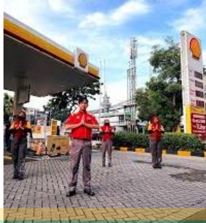
Gambar 1. 3 Pegawai SPBU Shell

Dengan mempertimbangkan pentingnya penerapan strategi komunikasi yang efektif dalam menghadapi krisis pasokan energi, penelitian ini bertujuan untuk memberikan pemahaman yang lebih komprehensif mengenai peran manajemen krisis dalam membentuk persepsi serta tingkat kepercayaan konsumen terhadap perusahaan. Meskipun berbagai teori dan penelitian terdahulu telah menegaskan pentingnya komunikasi krisis dalam menjaga reputasi organisasi, masih diperlukan kajian lebih lanjut mengenai sejauh mana penerapan manajemen krisis di sektor energi, khususnya pada konteks SPBU Shell Indonesia, mampu mempertahankan kepercayaan pelanggan di tengah kondisi kelangkaan BBM.