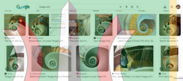
Gambar 1.4 Hasil Penelusuran “Tangga Sore”

Keterkaitan antara tangga spiral dan film Sore: Istri dari Masa Depan juga dapat diamati melalui penelusuran visual di ruang digital. Hasil penelusuran terhadap istilah “tangga Sore” menampilkan beragam citra yang secara konsisten merujuk pada visual poster film Sore , baik berupa poster resmi, tangkapan layar unggahan Instagram dan TikTok, maupun artikel media daring yang membahas lokasi tangga tersebut. Visual yang muncul menunjukkan kesamaan sudut pandang dari atas, bentuk spiral yang melingkar, serta penempatan subjek yang menyerupai komposisi poster film. Kemunculan visual-visual tersebut secara berulang memperlihatkan bahwa tangga spiral tidak lagi dipahami sekadar sebagai elemen arsitektural, tetapi telah diasosiasikan secara kuat sebagai penanda visual yang merepresentasikan film Sore di ruang digital.