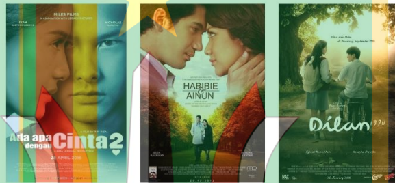
Gambar 1.1 Contoh Poster Film Romantis Indonesia

Namun demikian, romantisme dalam film tidak selalu direpresentasikan melalui visual yang eksplisit atau menonjolkan kemesraan secara langsung. Dalam beberapa karya, relasi romantis justru dibangun melalui simbol, ruang, struktur komposisi, serta elemen visual lain yang merepresentasikan dinamika hubungan, perubahan, pilihan hidup, dan perjalanan waktu. Dengan kata lain, makna romantis dapat dikonstruksi secara simbolik dan tidak selalu ditampilkan dalam bentuk visual yang “manis” atau afektif secara langsung.