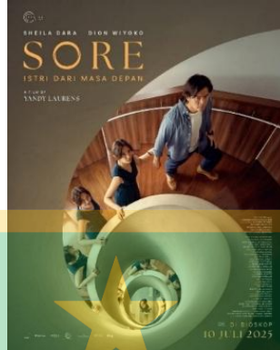
Gambar 1.2 Poster Film Sore: Istri dari Masa Depan

elemen visual lainnya yang bersifat metaforis. Romantisme dalam poster Sore direpresentasikan secara reflektif dan simbolik, bukan melalui gambaran kemesraan yang secara langsung terlihat.