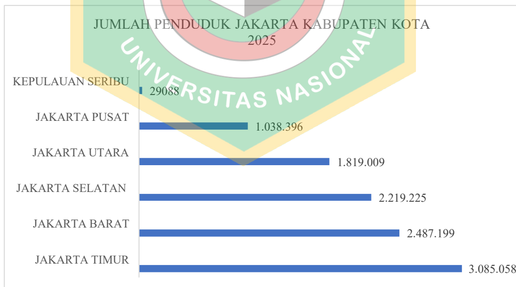
Gambar 1. 1 Grafik Jumlah Penduduk Jakarta dan kabupaten kota 2025

Indonesia sebagai negara dengan jumlah penduduk yang sangat besar menghadapi tantangan serius dalam penyebaran penduduk yang tidak merata. Salah satu penyebab utamanya adalah urbanisasi dari desa ke kota, yang menyebabkan wilayah perkotaan menjadi semakin padat. Contoh nyata terlihat di Provinsi DKI Jakarta, di mana pertumbuhan penduduk yang pesat mendorong pembangunan berbagai infrastruktur seperti perumahan, gedung perkantoran, dan fasilitas publik lainnya. Laju pembangunan ini secara tidak langsung mengurangi ketersediaan ruang terbuka hijau yang seharusnya menjadi ruang gerak masyarakat. Dampaknya, ruang publik yang ada menjadi semakin terbatas, baik dari segi luas maupun kualitasnya. Tekanan terhadap sumber daya alam dan lingkungan pun semakin berat, yang ditandai dengan meningkatnya tingkat polusi udara serta kemacetan lalu lintas akibat tingginya mobilitas masyarakat yang mengandalkan kendaraan pribadi.