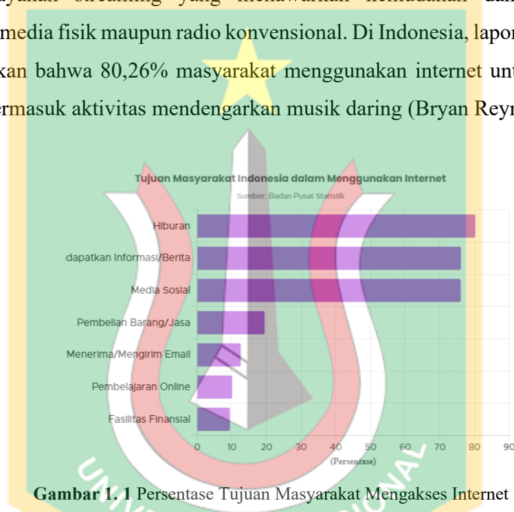
Gambar 1. 1 Persentase Tujuan Masyarakat Mengakses Internet

Kemajuan teknologi digital dan meluasnya akses internet telah mengubah cara masyarakat menikmati hiburan, termasuk musik. Musik kini lebih banyak diakses melalui layanan streaming yang menawarkan kemudahan dan fleksibilitas dibanding media fisik maupun radio konvensional. Di Indonesia, laporan GoodStats menunjukkan bahwa 80,26% masyarakat menggunakan internet untuk keperluan hiburan, termasuk aktivitas mendengarkan musik daring (Bryan Reynaldy, 2024).