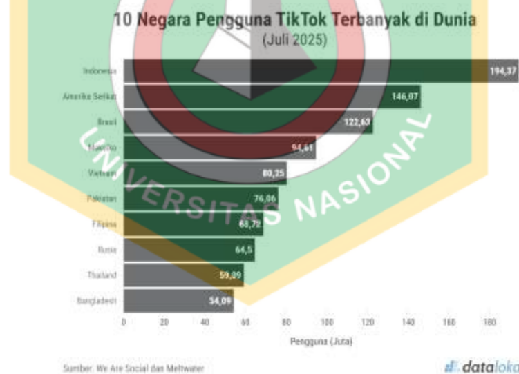
Gambar 1.1 Indonesia Pengguna Tiktok Terbanyak di Dunia

Dalam konteks pemasaran digital, Wardah memiliki beberapa akun sosial media seperti Instagram, Tiktok, X, dan Facebook. Khususnya di platform media sosial seperti TikTok, kedua jalur pemrosesan ini sangat penting untuk dipertimbangkan, mengingat konten promosi yang disajikan tidak hanya menawarkan informasi substantif, tetapi juga mengandalkan aspek inovasi produk, visualisasi konten tiktok, keterlibatan influencer , kualitas informasi, popularitas produk dan membentuk persepsi konsumen. Dalam konteks penelitian sosial, fenomena perilaku konsumen tersebut dapat di analisis melalui pendekatan ilmiah yang sistematis untuk mengamati hubungan antara daya tarik produk yang ditampilkan melalui media digital dengan keputusan pembelian konsumen (Sugiyono, 2023).