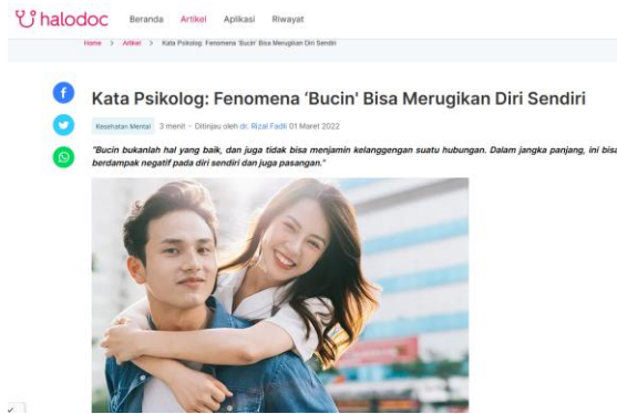
Gambar 2 Artikel Berita Kedua Dampak Fenomena Bucin