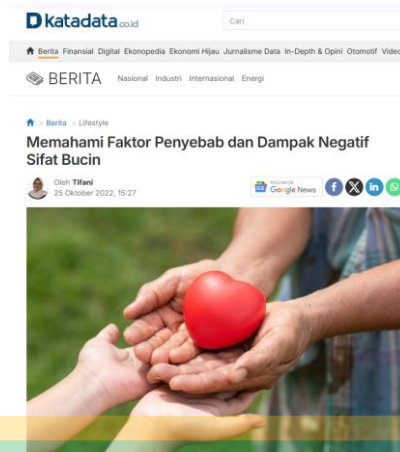
Gambar 3 Artikel Ketiga Fenomena Bucin Faktor Penyebab dan Dampak Negatif

Sumber : Memahami Faktor Penyebab dan Dampak Negatif Sifat Bucin . Retrieved January 18, 2025, from Katadata .