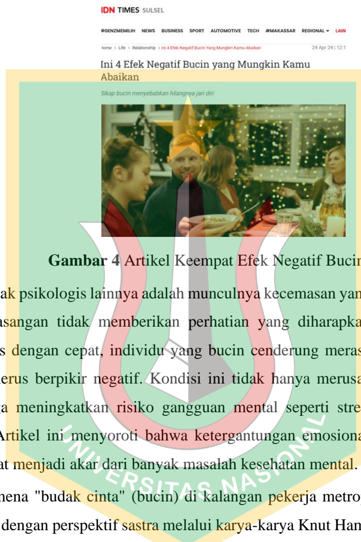
Gambar 4 Artikel Keempat Efek Negatif Bucin

hilangnya jati diri, isolasi sosial, dan dampak pada kesehatan mental menunjukkan bahwa bucin bukanlah sekadar tren, tetapi masalah yang memerlukan perhatian serius. Dengan pendekatan yang holistik dan dukungan yang tepat, individu dapat melepaskan diri dari pola bucin dan menikmati hubungan yang lebih seimbang serta mendukung pertumbuhan pribadi mereka.