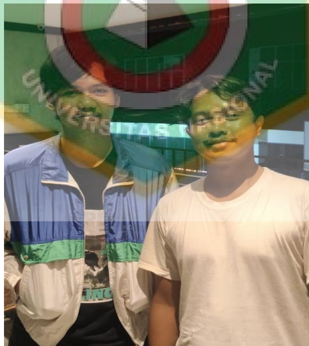
Dokumentasi Bersama Redaktur Pelaksana Ruanginfo.id