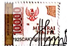
Cika Amelia Putri