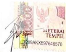
Putu Leong Uni Berta