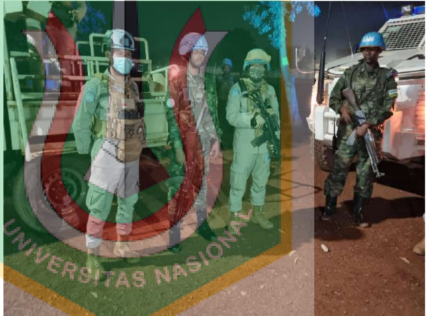
Gambar 8. Patroli