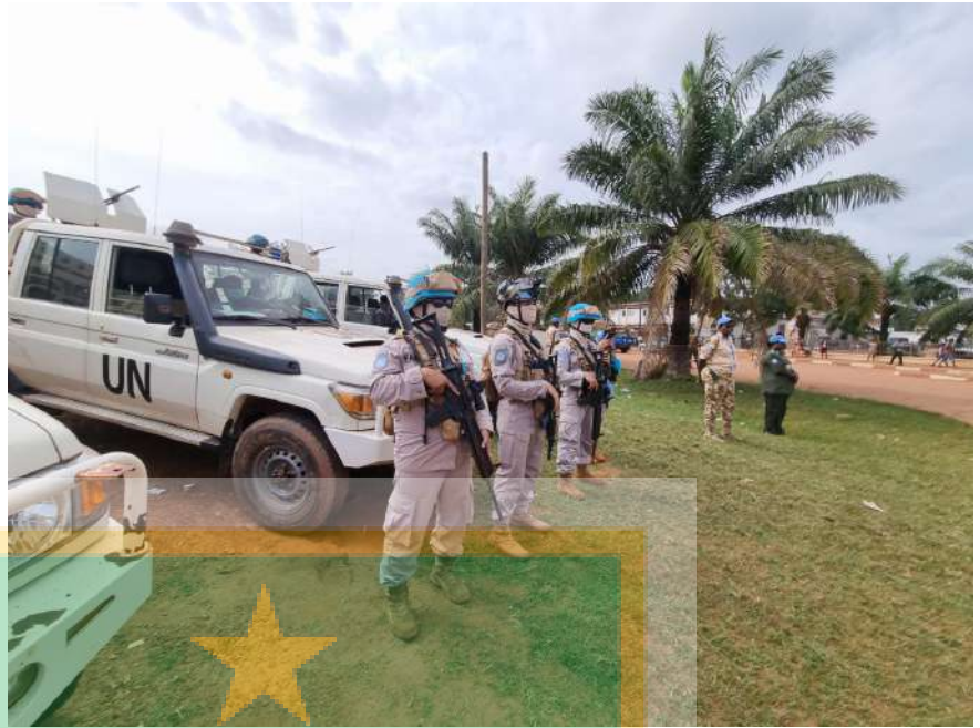
Gambar 7. Quick Respon Force