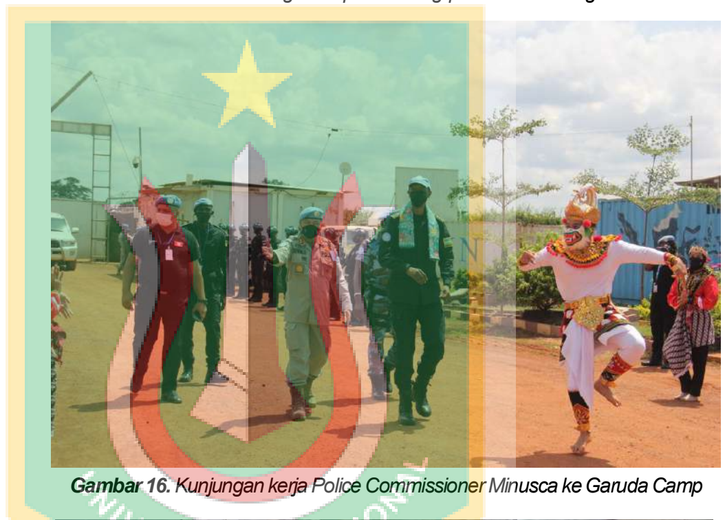
Gambar 16. Kunjungan kerja Police Commissioner Minusca ke Garuda Camp