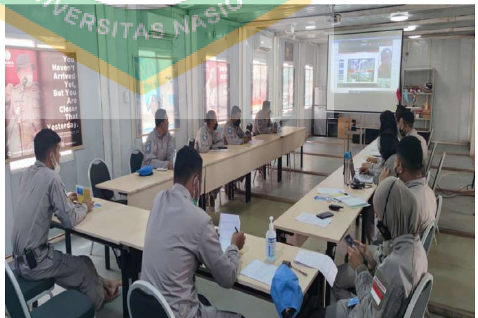
Gambar 17. Kegiatan rapat anev mingguan