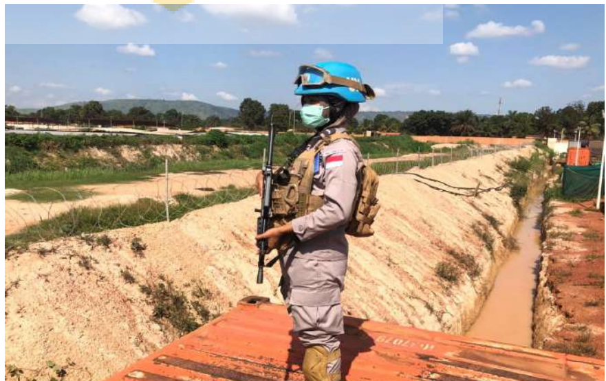
Gambar 9. Static Guard MorBatt