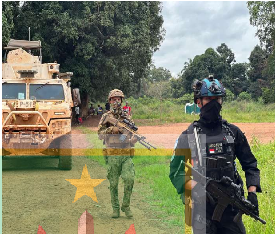
Gambar 13. Patroli Gabungan Peleton SWAT Satgas FPU 3 Minusca dengan Pasukan QRF Portugal di Bakouma