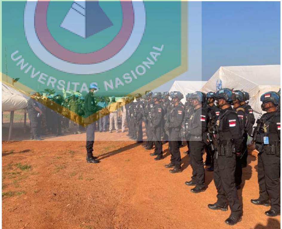
Gambar 12. Kunjungan Police Commisioner Minusca kepada Peleton SWAT saat deploy di Tagbara