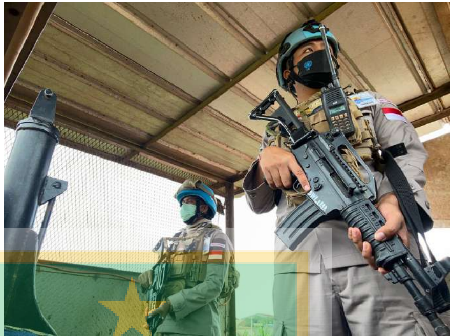
Gambar 10. Security Camp