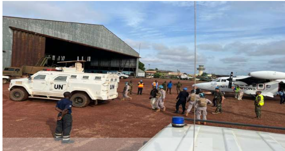
Gambar 15. Pengawasan tahanan