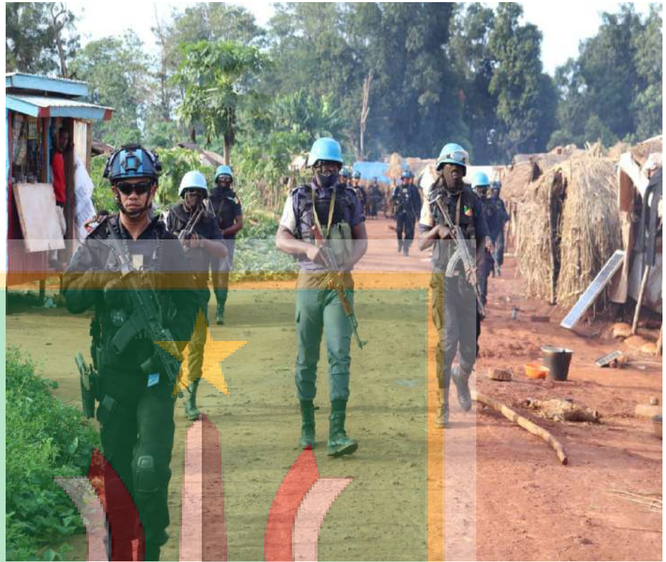
Gambar 11. SWAT FPU INDONESIA Deployment to Bambari