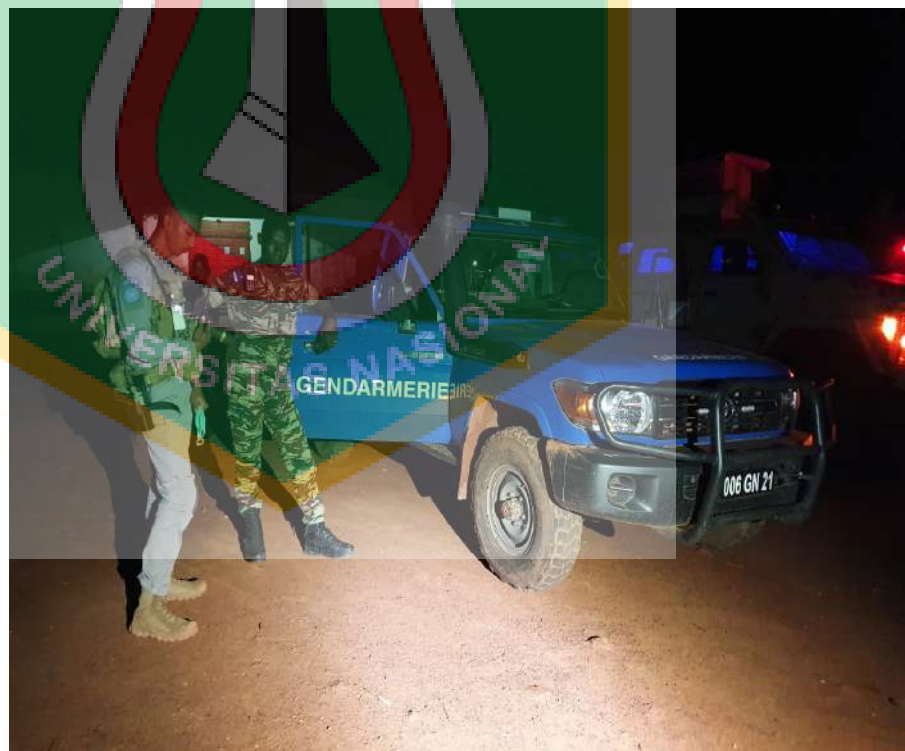
Gambar 14. Patroli Gabungan dengan Gendarmarie Kota Bangui