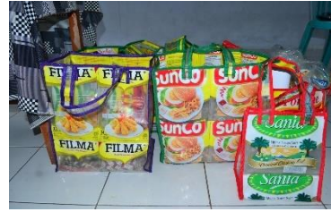
Gambar 7 Hasil Kreatif Tas