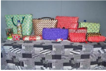
Gambar 8 Hasil Kreatif Dompot