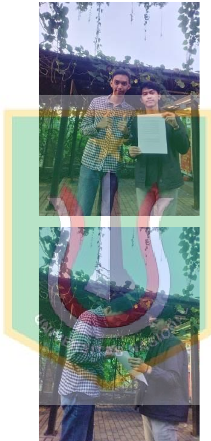
Lampiran: Wawancara informan pendukung