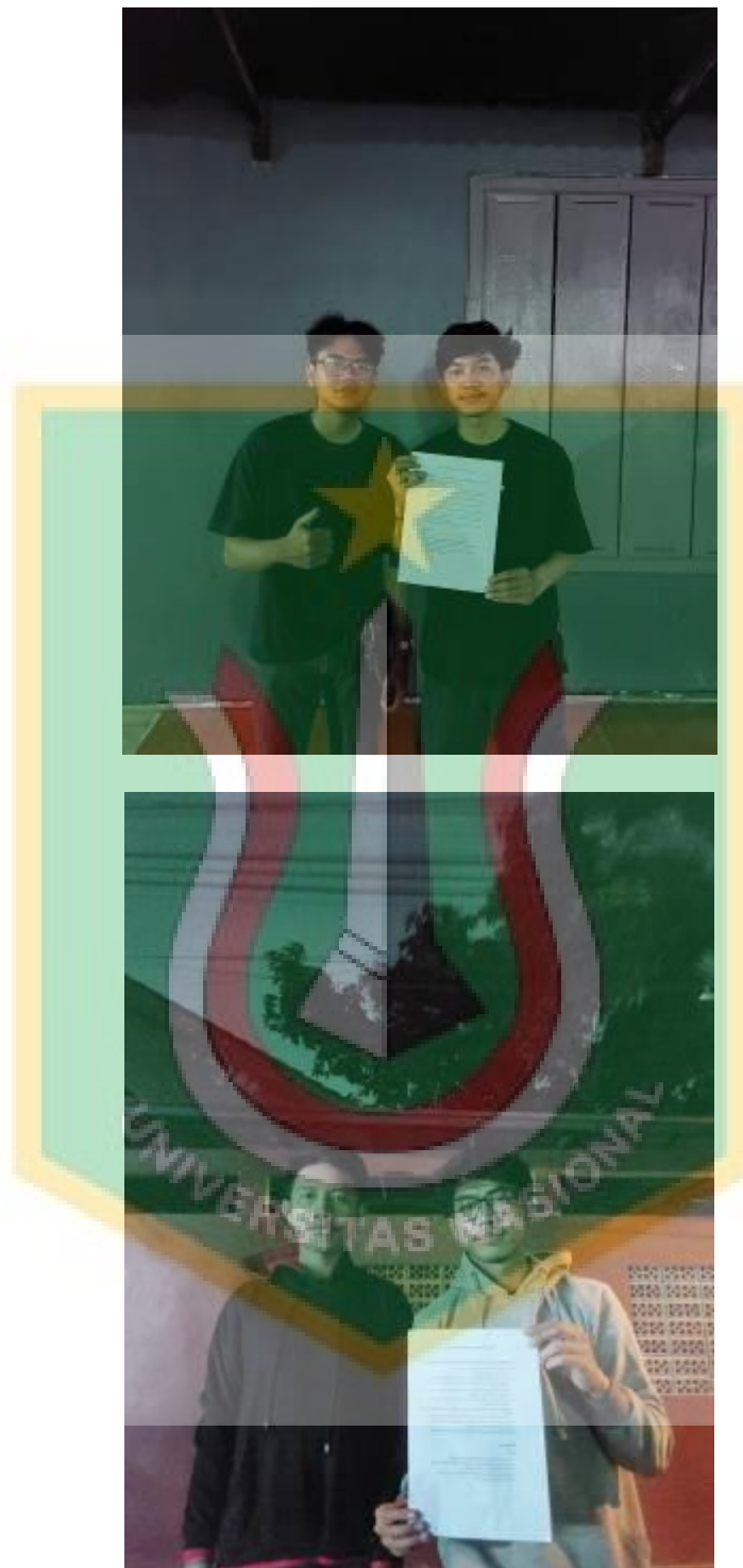
Lampiran: Kunjungan ke Store Shoes and Care Depok