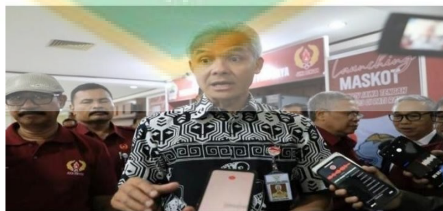
Gubernur Jawa Tengah, Ganjar Pranowo kecewa atas keputusan FIFA yang membatalkan Indonesia sebagai tuan rumah Piala Dunia U-20 2023.