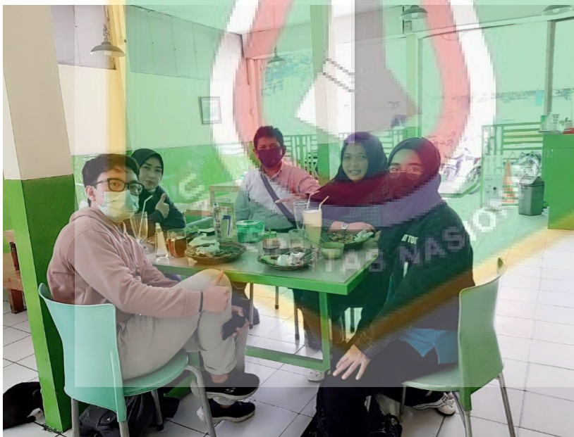
Wawancara dengan Ketua Lembaga Musyawarah Kelurahan (LMK) Cililitan dan Pendamsos Kelurahan Cililitan