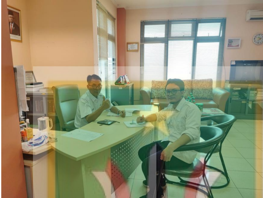
Wawancara dengan Lurah Cililitan