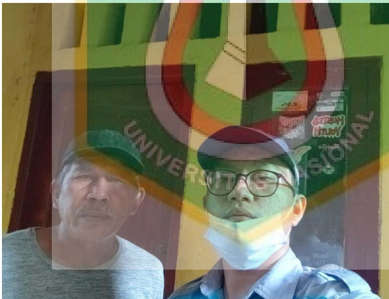
Wawancara dengan Ketua RT 016/007 Kelurahan Cililitan