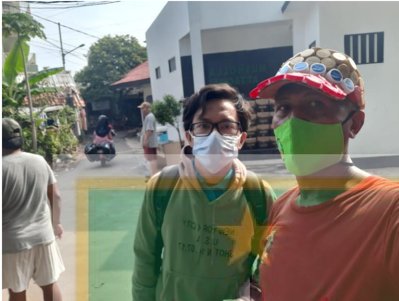
Wawancara dengan Ketua RW 001 Kelurahan Cililitan