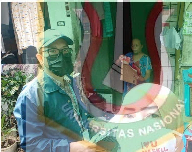
Mengunjungi penerima bantuan PKH di Kelurahan Cililitan didampingi oleh Pendamsos Kelurahan Cililitan