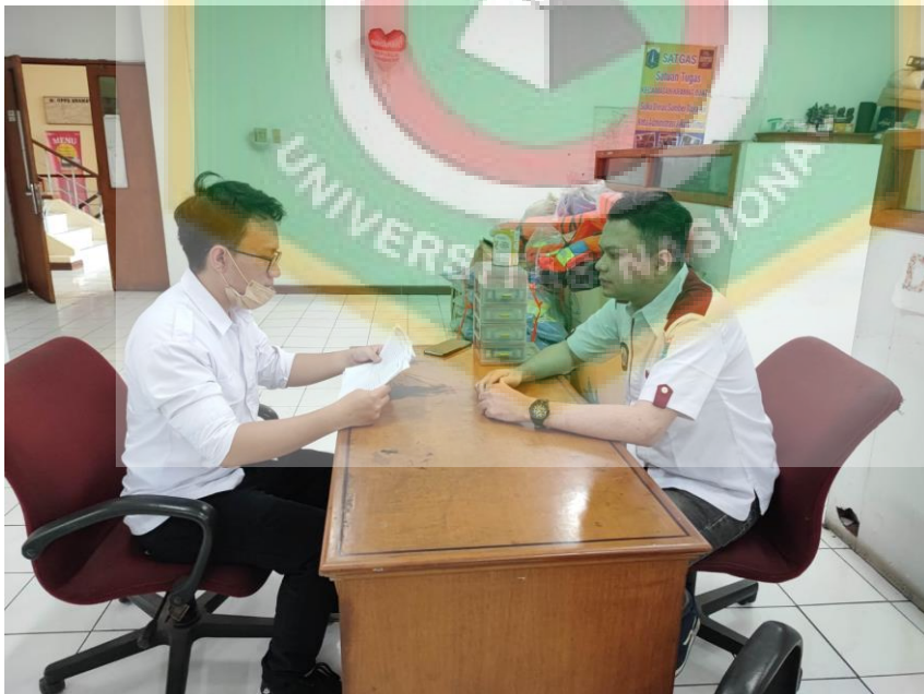
Wawancara dengan Pendamping PKH Kelurahan Cililitan