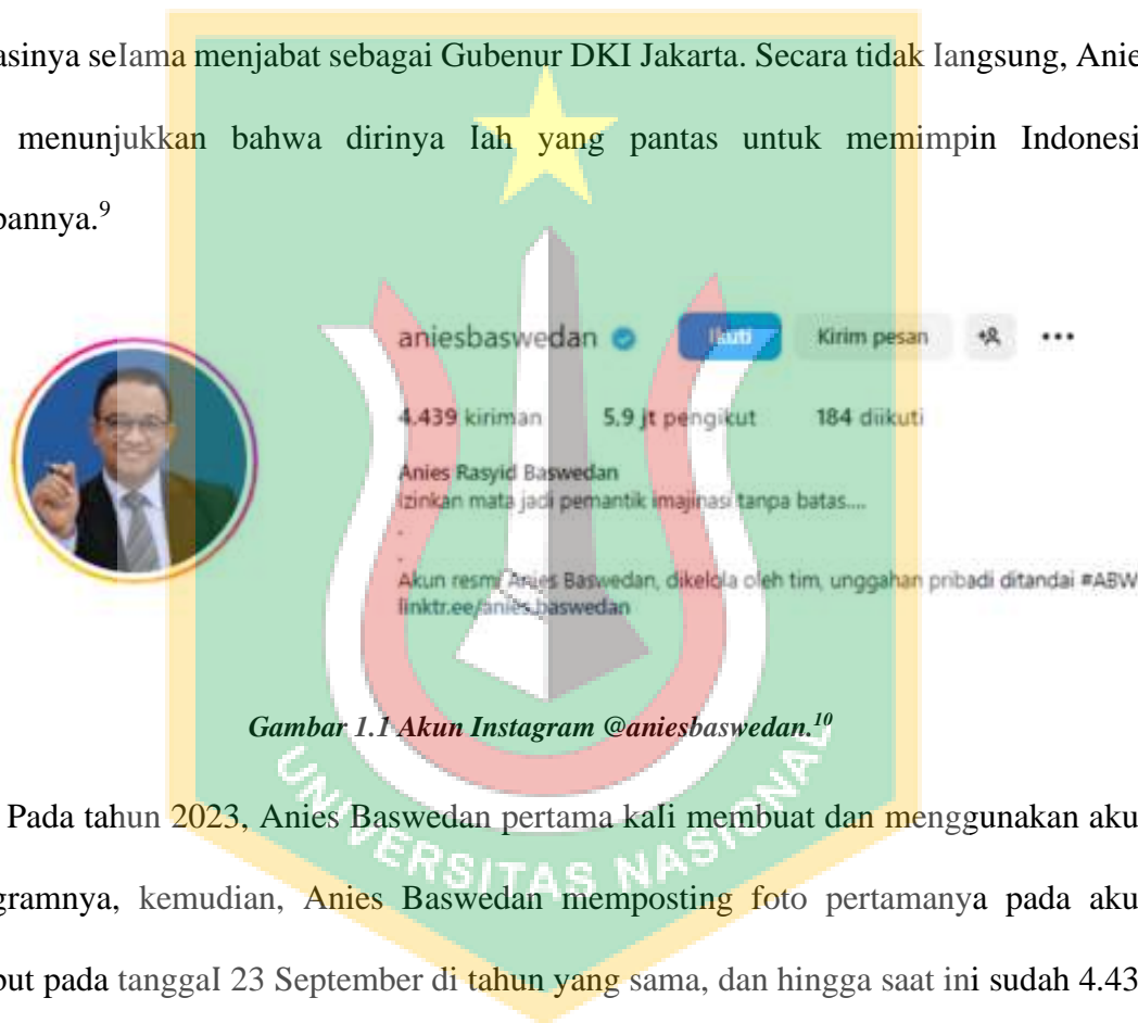
Gambar 1.1 Akun Instagram @aniesbaswedan. 10

Melalui instagram, banyak postingan-postingan yang diupload melalui akun instagram @aniesbaswedan baik foto dan video yang digunakan dalam rangka menciptakan persatuan masyarakat sekaligus melakukan promosi diri melalui sharing prestasinya selama menjabat sebagai Gubernur DKI Jakarta. Secara tidak langsung, Anies telah menunjukkan bahwa dirinya lah yang pantas untuk memimpin Indonesia kedepannya. 9