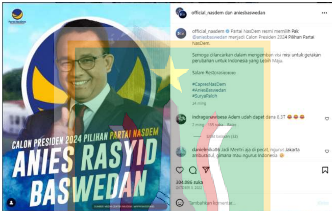
Gambar 1.2. Pengumuman Resmi Anies Baswedan melalui Instagram sebagai Capres 2024. 11

Pengumuman secara resmi Anies sebagai Calon Presiden 2024 pilihan Partai NasDem di unggah melalui Instagram @aniesbaswedan dan @official_nasdem pada tanggal 3 Oktober 2022 dengan tambahan hashtag (#) CapresNasDem.