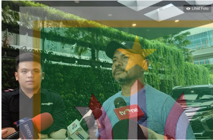
Pihak Keluarga D, Alto Luger saat ditemui wartawan di RS Mayapada, Setiabudi Jakarta Selatan, Jumat (3/3/2023).

Baca berita tanpa iklan. Gabung Kompas.com+