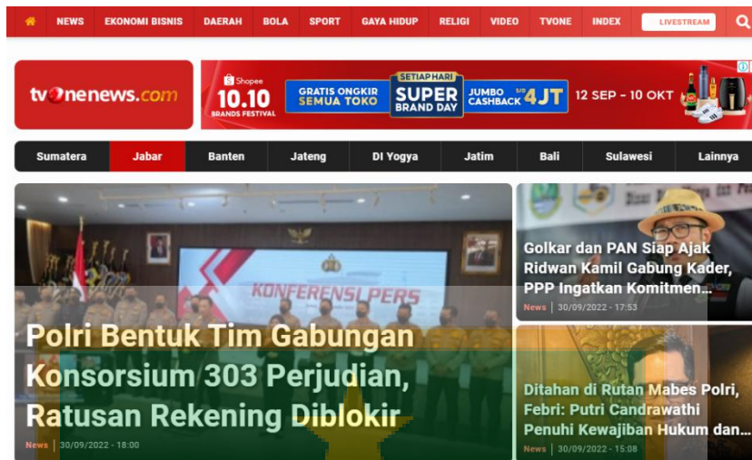
Gambar 1.2 Website Portal Online tvOnenew.com 3

Salah satu penelitian yang penulis ambil saat ini, yaitu portal berita tvOnenews.com. Portal berita tvOnenews.com adalah produk dari program televisi tvOne. tvOne merupakan stasiun televisi nasional yang menyajikan berita 24jam dengan berbagai informasi mulai dari peristiwa hingga politik yang terjadi di Indonesia.