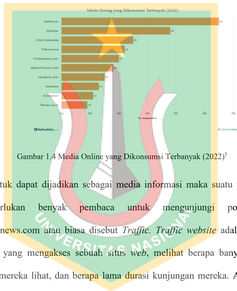
Gambar 1.4 Media Online yang Dikonsumsi Terbanyak (2022) 5

tvOnenews.com dikenal khalayak baru-baru ini . Selain itu, berdasarkan survei yang dilansir dalam databoks.katadata.co.id tvOnenews.com masuk kedalam 10 besar media online yang sering dikonsumsi masyarakat di Indonesia dan tvOnenews.com masuk pada urutan ke-5 setelah tribunnews.com.