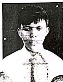
SEKOLAH KHUSUS YKDW 03

dari sekolah menengah atas luar biasa setelah memenuhi seluruh kriteria sesuai dengan peraturan perundang-undangan.