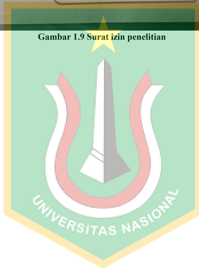
Gambar 1.9 Surat izin penelitian

Kepada Yth. : Bapak/Ibu Pimpinan, Kampung Adat Praijing Desa Tebara, Waikabubak, Kab. Sumba Barat, Nusa Tenggara Timur