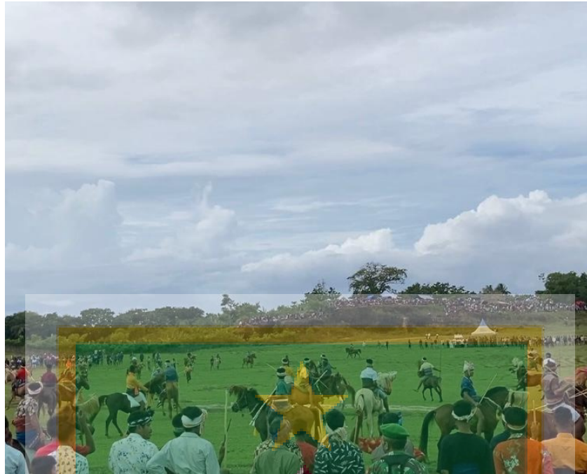
Gambar 1.7 Pertandingan Pasola