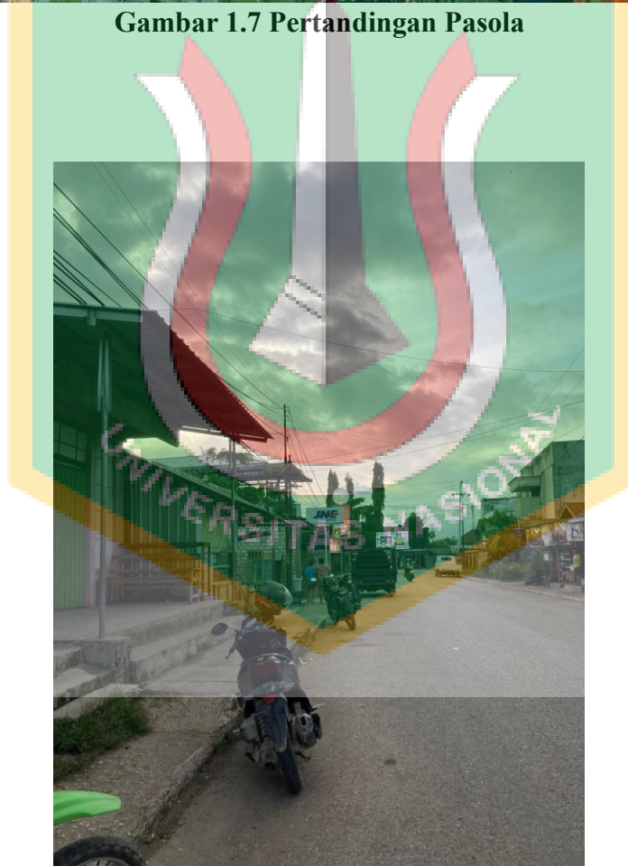
Gambar 1.8 Akses menuju event Pasola