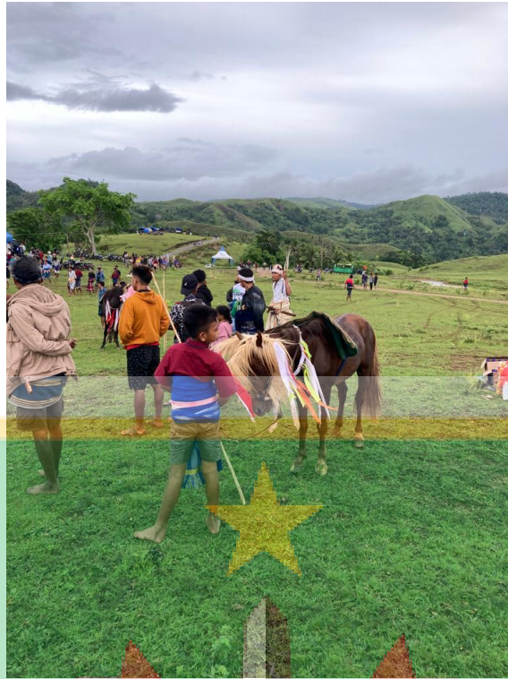
Gambar 1.3 Anak kecil dengan seekor kuda