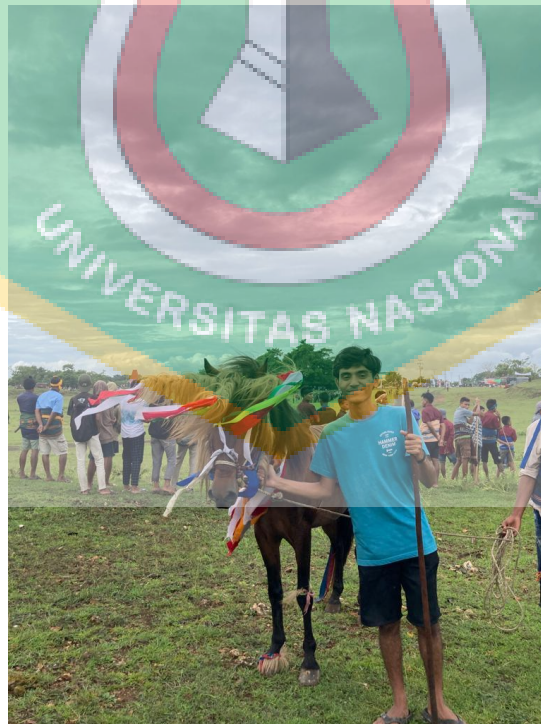
Gambar 1.2 Penulis dengan kuda yang sudah di rias