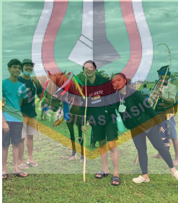
Gambar 1.4 Penulis dengan rekan-rekan dari Universitas Nasional