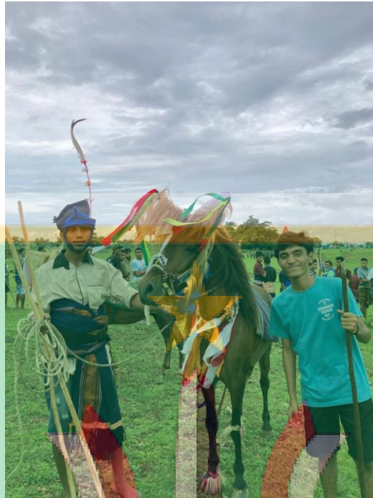
Gambar 1.1 Penulis dengan peserta event budaya Pasola