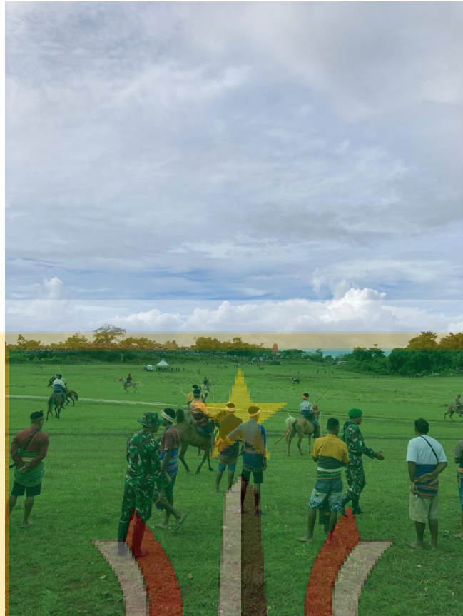
Gambar 1.5 Lokasi event Pasola