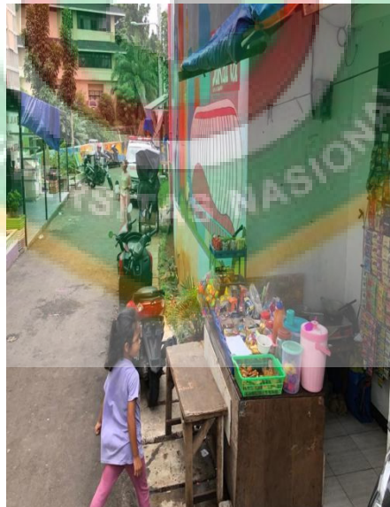
Gambar 9 Keadaan salah satu warung milik masyarakat di wilayah RW.01 Kelurahan Cipinang Besar Utara