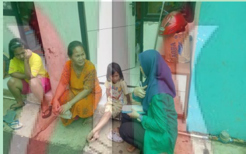
Gambar 2 Wawancara dengan Masyarakat RW.01 Kelurahan Cipinang Besar Utara