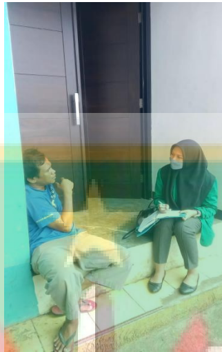
Gambar 6 Wawancara dengan Masyarakat RW.01 Kelurahan Cipinang Besar Utara