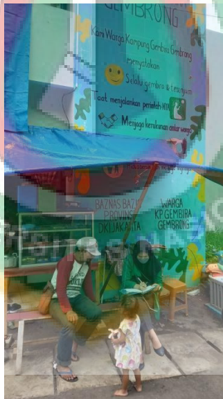
Gambar 5 Wawancara dengan Masyarakat RW.01 Kelurahan Cipinang Besar Utara