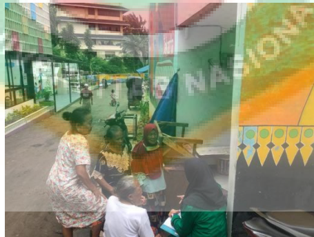
Gambar 3 Wawancara dengan Masyarakat RW.01 Kelurahan Cipinang Besar Utara