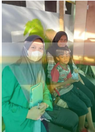
Gambar 4 Wawancara dengan Masyarakat RW.01 Kelurahan Cipinang Besar Utara