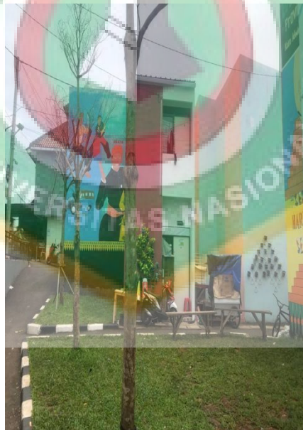
Gambar 11 Tampak Depan Salah Satu Bangunan Rumah Warga Setelah di Revitalisasi