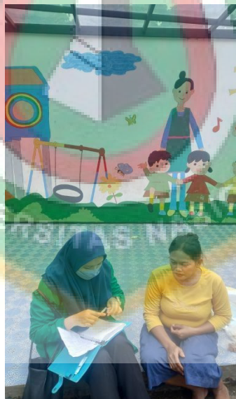
Gambar 7 Wawancara dengan Masyarakat RW.01 Kelurahan Cipinang Besar Utara