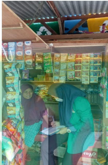
Gambar 8 Wawancara dengan Masyarakat RW.01 Kelurahan Cipinang Besar Utara