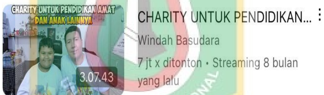
Gambar 1.2 Playlist Charity/Penggalangan Dana Untuk Sesama Sumber Kanal YouTube Windah Basudara

Pada kontein charity pada live streaming Windah Basudara yang mengajak Amat yang merupakan anak berkeibutuhan khusus yang saat itu viral di jagad media sosial karna terlihat anak kecil yang pekeirja keras. Konten tersebut tayang pada 11 Oktober 2022 dengan 386rb like dan 7.047.210 ditonton. melalui dengan kitabisa.com hasil donasi tersebut dialokasikan ke 2 lembaga penggalang dana terverivikasi yaitu :