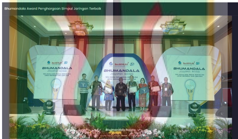
(Acara Bhumandala award)