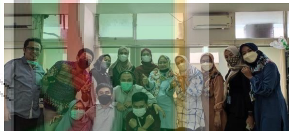
(Dokumentasi bersama Para informan)