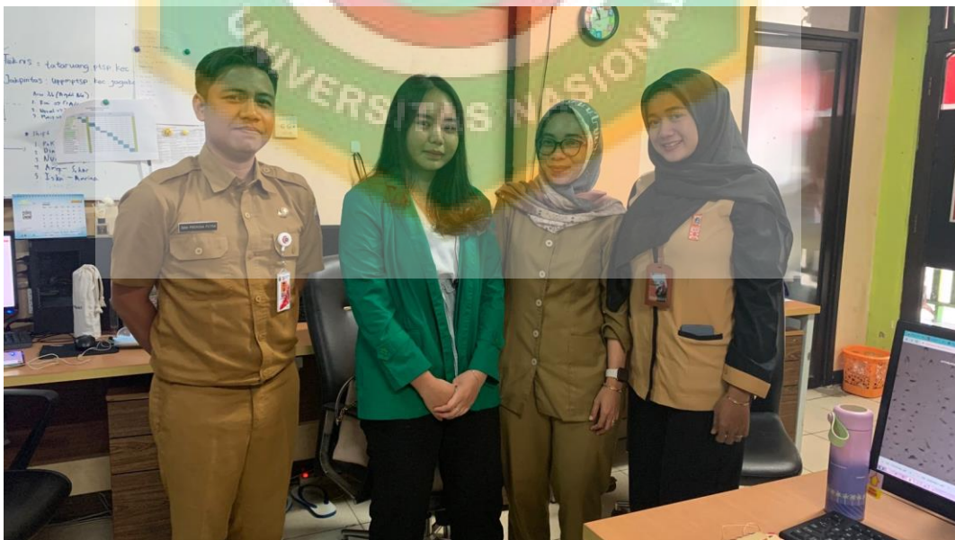
Foto Bersama Narasumber Bagian PTSP di Kecamatan Jagakarsa