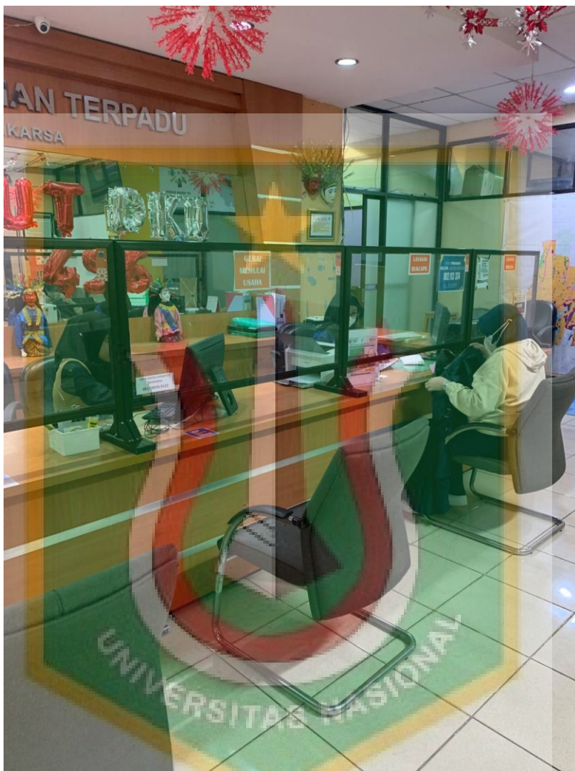
Foto Lokasi PTSP Kecamatan Jagakarsa