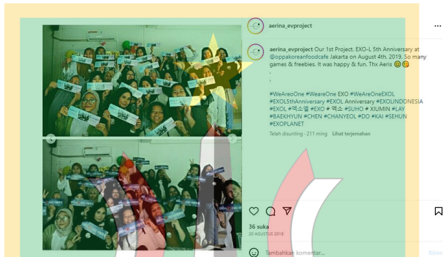
Gambar 1.4 Project pertama Aerina Evproject

Aerina Evproject sendiri sudah membuat project tentang EXO sejak 2019. 5