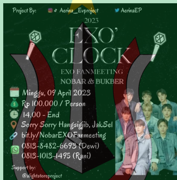
Gambar 1.1 Poster project nonton bareng EXO'Clock

Project nonton bareng EXO'Clock oleh @aerina_evproject dilaksanakan pada tanggal 9 April 2023 di salah satu cafe yang terletak di Jakarta Selatan. 1