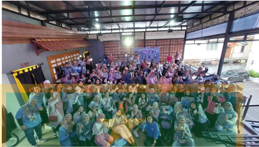
Gambar 1.3 Penonton project nonton bareng EXO'Clock oleh Aerina evproject

Aerina Evproject memeriahkan project dengan berbagai kegiatan yang sudah disiapkan oleh para admin. Untuk penonton yang berpartisipasi akan diberikan freebies ketika melakukan registrasi ulang.