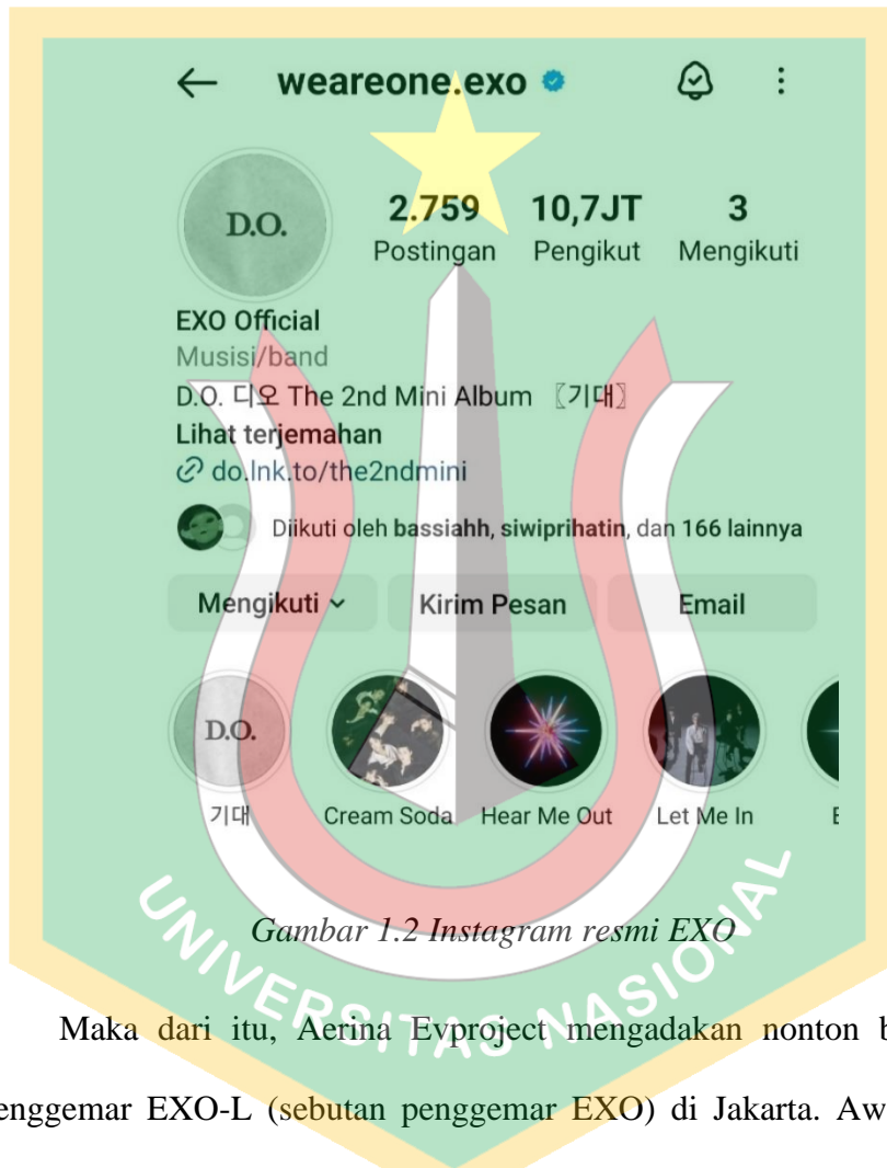
Gambar 1.2 Instagram resmi EXO

melalui platform Beyond Live 3 untuk penggemar yang tidak bisa hadir langsung. Untuk jumlah penggemar EXO sendiri dapat dilihat berdasarkan Instagram resmi EXO yaitu @weareoneexo memiliki kurang lebih 10 juta followers. 4