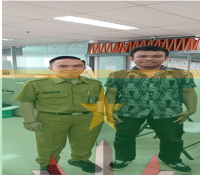
Wawancara dengan Kepala Bidang Prasarana dan Sarana Utilitas Kota Dinas Bina Marga DKI Jakarta