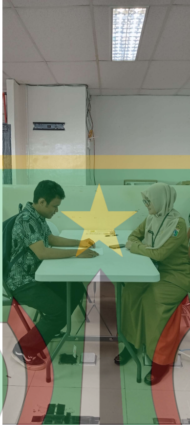
Wawancara dengan Staff Perencanaan Bidang Prasarana dan Sarana Utilitas Kota Dinas Bina Marga DKI Jakarta