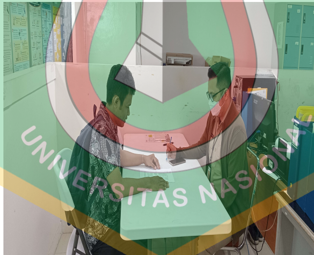
Wawancara dengan Staff Perencanaan Bidang Prasarana dan Sarana Utilitas Kota Dinas Bina Marga DKI Jakarta