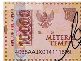
Belva Salsabila Fauzie