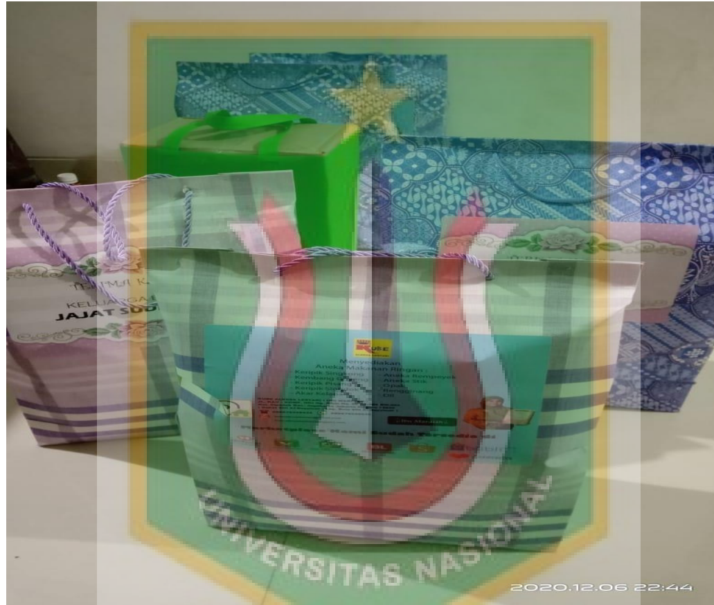
Gambar 5. Hampers Keripik Singkong Ibu Mardiah