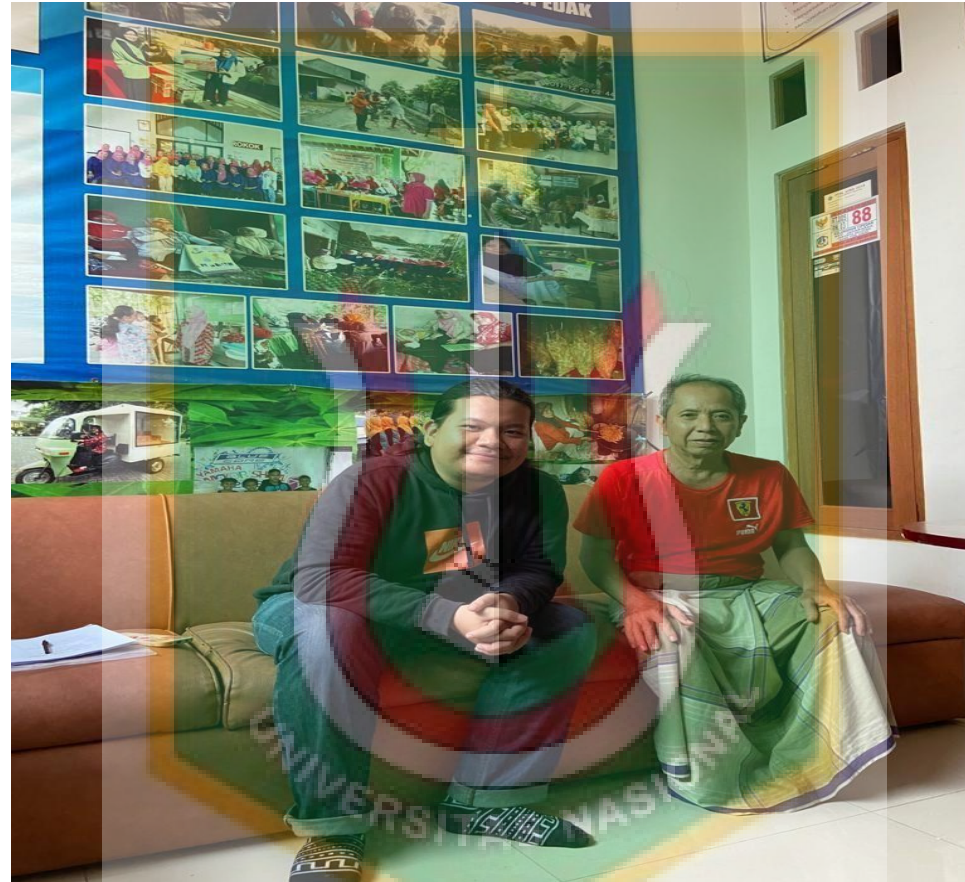
Gambar 13. Foto Bersama Sahabis Wawancara Dengan Reseller