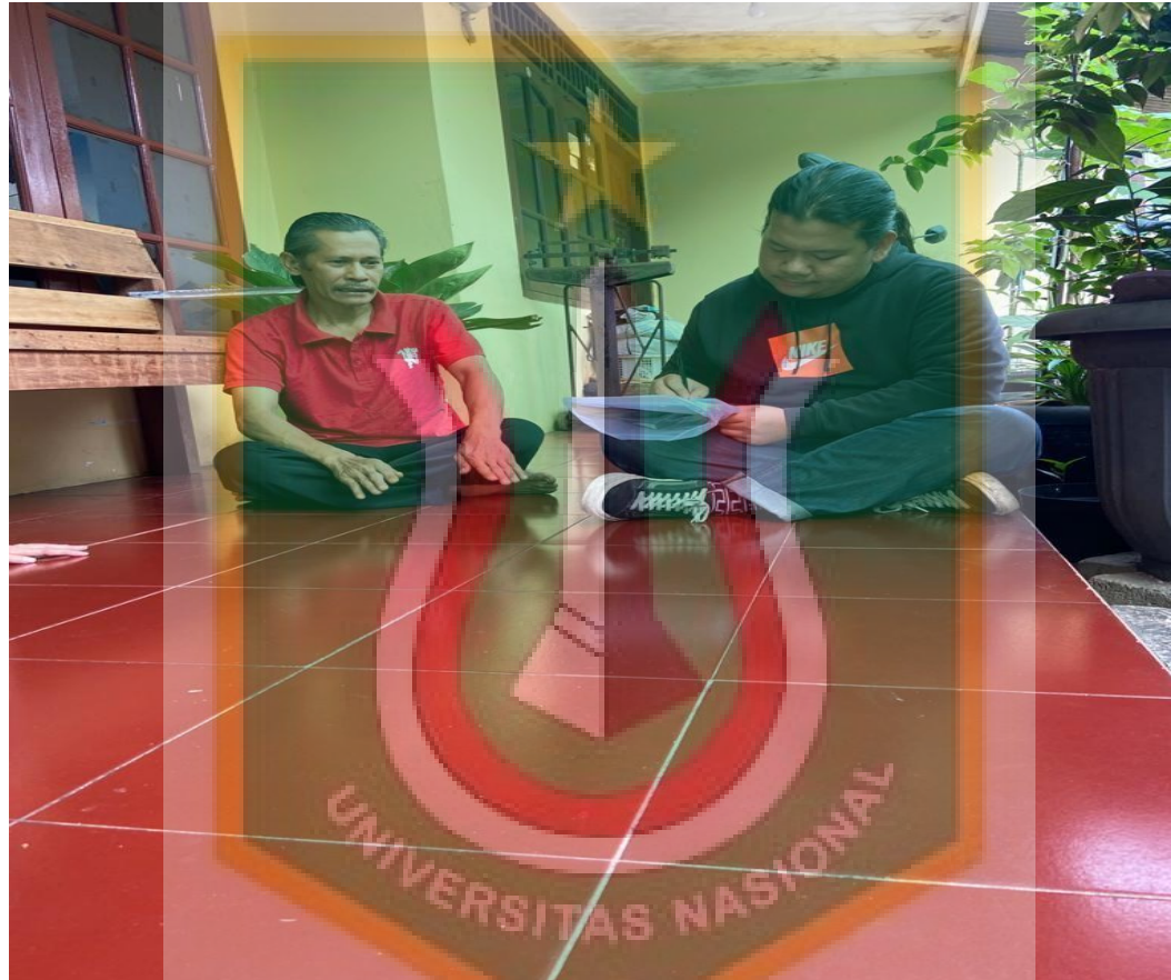
Gambar 11. Wawancara Bersama Pekerja Produksi