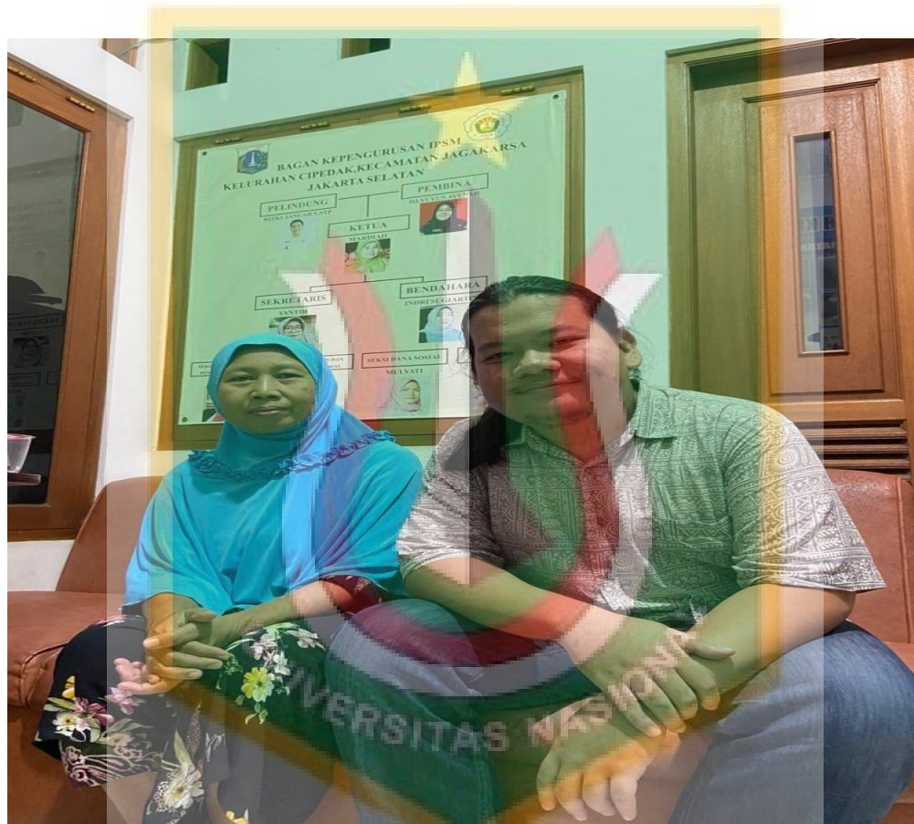
Gambar 8. Peneliti Bersama Responden