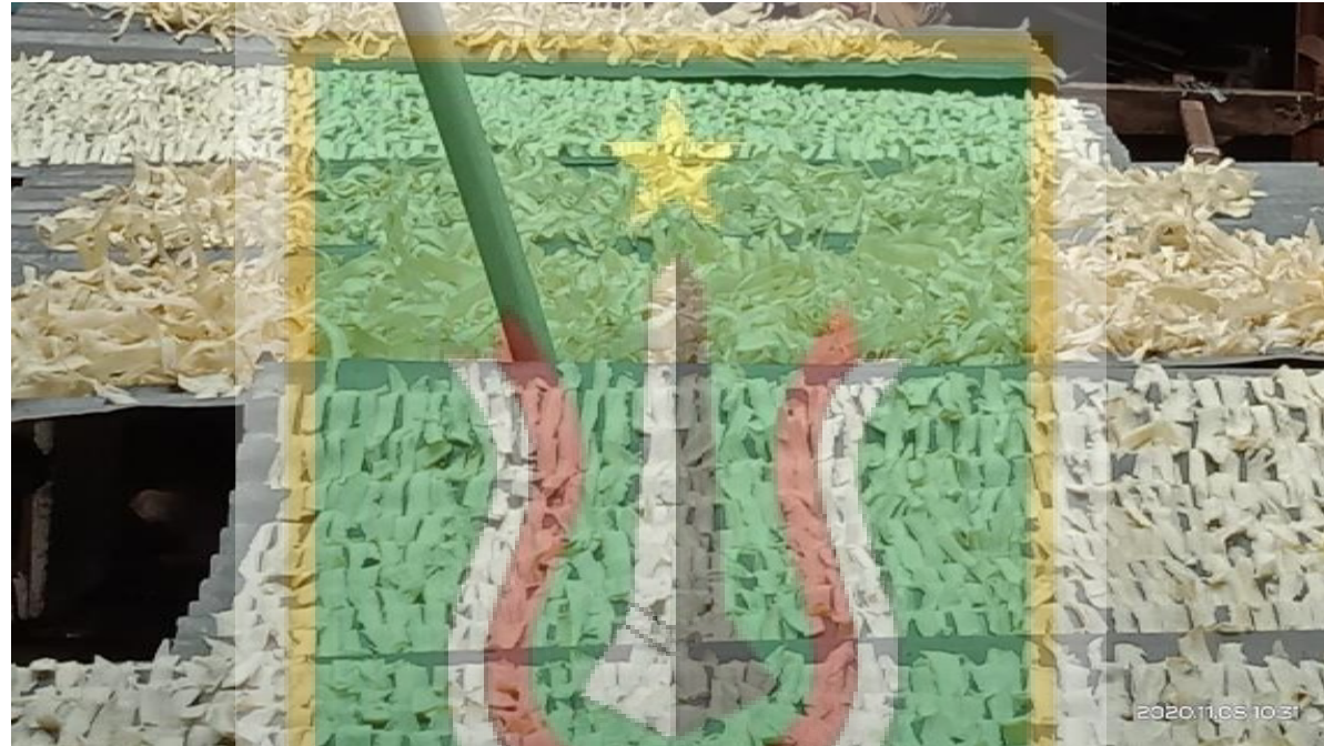
Gambar 2. Proses Penjemuran Keripik