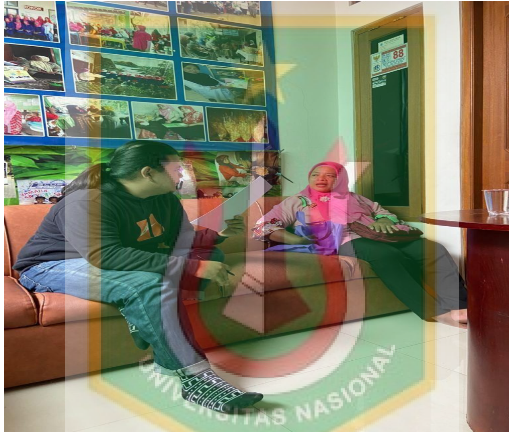
Gambar 12. Wawancara Bersama Reseller