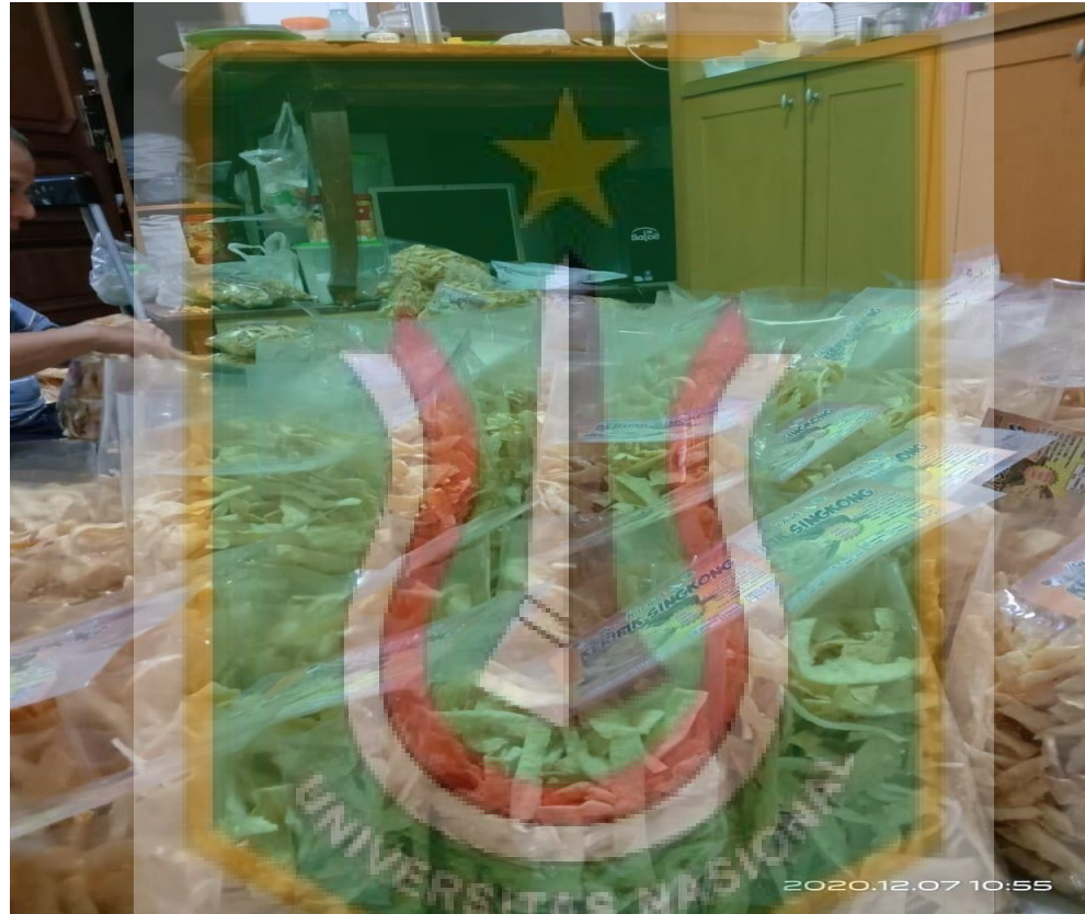
Gambar 4. Proses Pengemasan Keripik Singkong