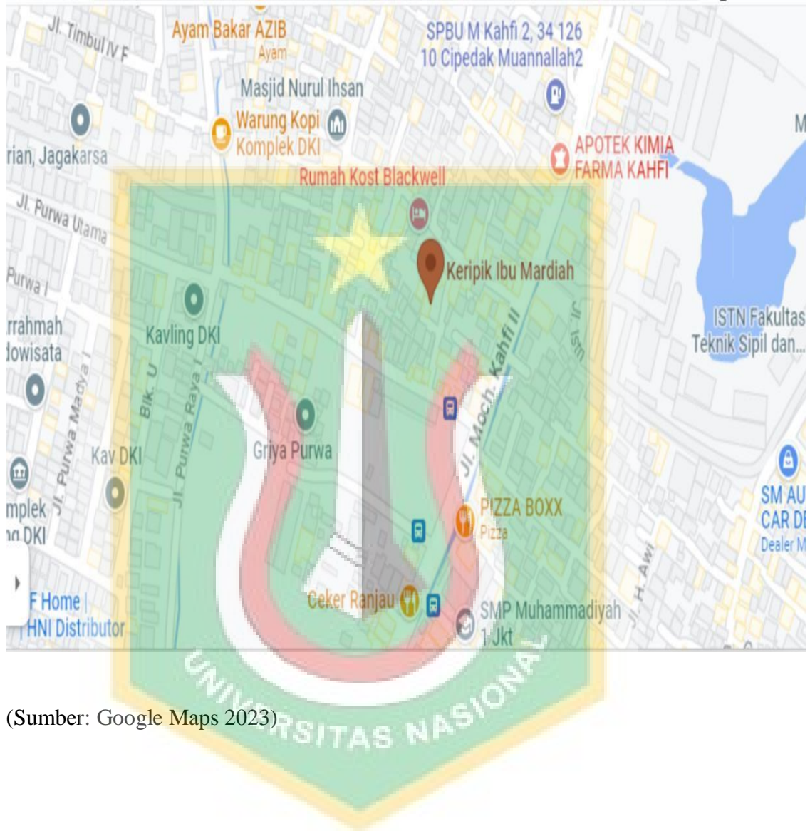
Lampiran 1. Denah Lokasi Keripik Singkong Ibu Mardiah