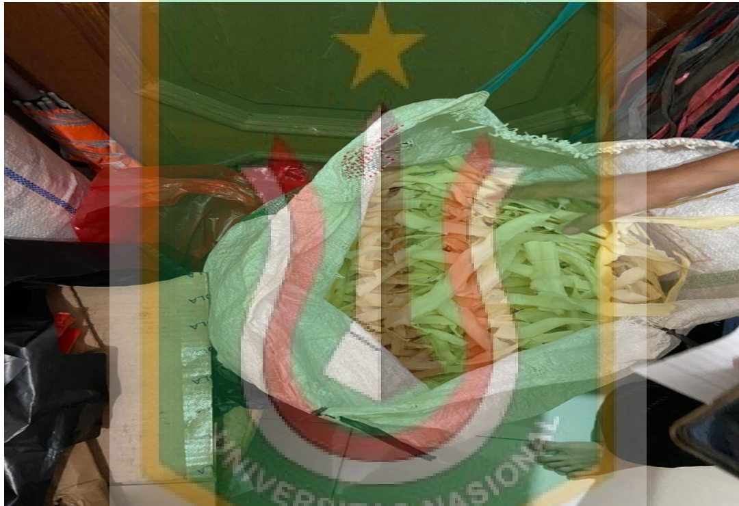
Gambar 3. Keripik Sudah Siap Digoreng