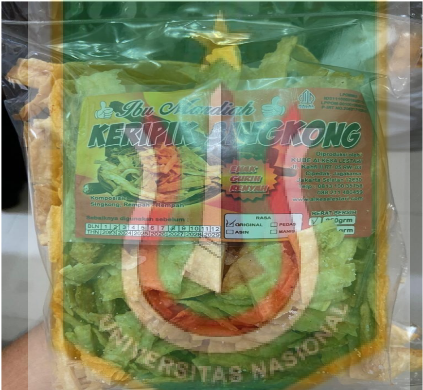
Lampiran 6. Keripik Singkong Ibu Mardiah