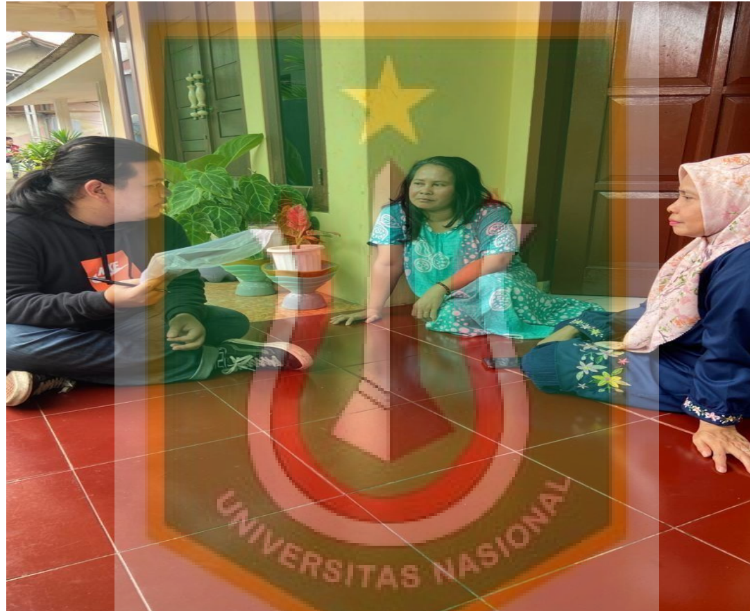
Gambar 10. Wawancara Bersama Pekerja Produksi