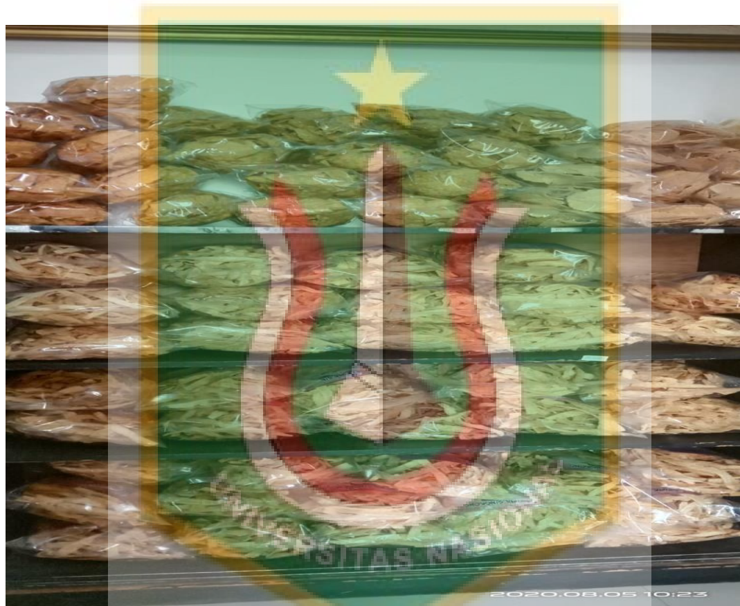
Gambar 6. Keripik Yang Sudah Siap Dijual