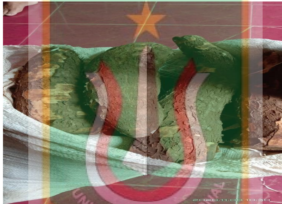
Gambar 1. Bahan Dasar Keripik Singkong (Umbi Singkong)