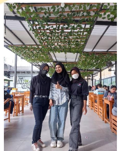
Desain Interior dan Karyawan Mie Gacoan