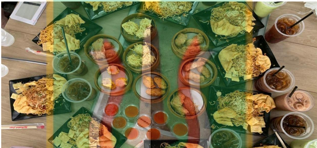
Produk Mie Gacoan