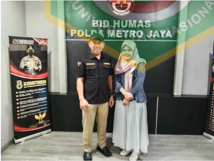
Dokumentasi dengan informan 1

permohonan maaf setelah terjadinya krisis beberapa waktu lalu, telah disampaikan secara langsung oleh Kapolda Metro Jaya, dan juga disampaikan kembali oleh Kabid Humas Polda Metro Jaya melalui Press Release di depan para media (baik media cetak, elektronik, maupun online), yang ditayangkan ke beberapa media (baik media cetak, elektronik, maupun online) dan media sosial milik Humas Polda Metro Jaya.