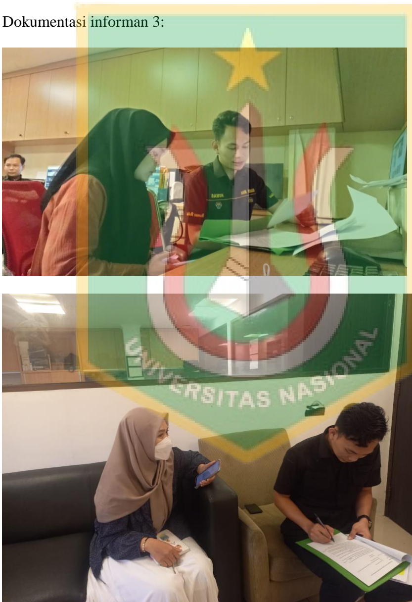
Dokumentasi informan 3: