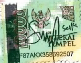
Salsa Bila Ayunda

Jakarta, 02 Maret 2023 Yang Membuat Pernyataan,