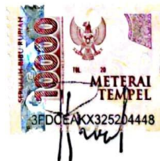
Rio Nur Maulana