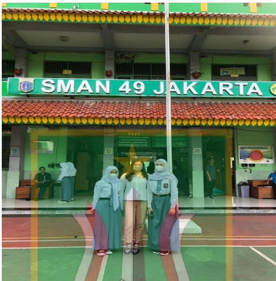
Gambar 13 Dokumentasi

Dokumentasi Foto Bersama Pelajar Siswi SMAN 49 Jakarta Amanda (Duta RANSEL) dan Syafira Pelajar SMAN 49 Jakarta.