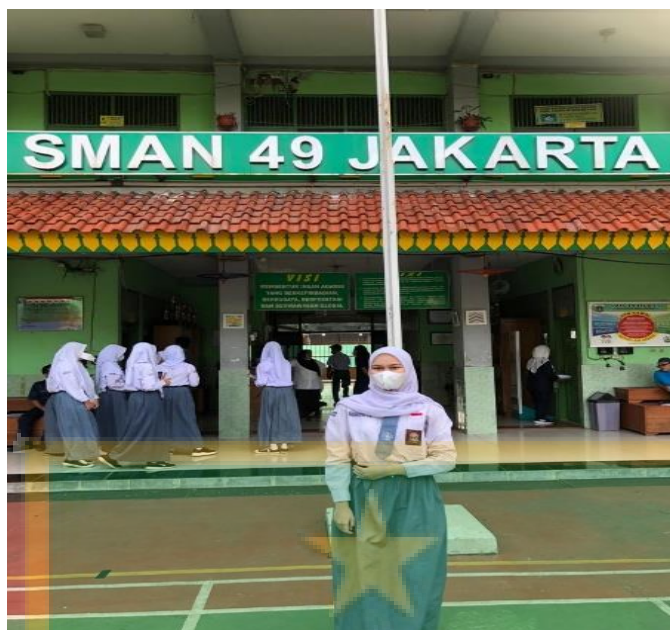
Gambar 14 Dokumentasi