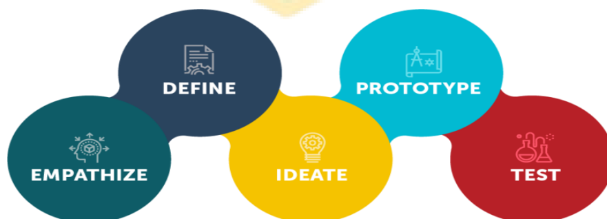
Gambar 2.1 Tahapan Design Thinking

Menurut (Fatimah Almira Firdausi, 2021) Metode Design Thinking memiliki 5 tahapan, yaitu: