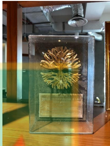
Penghargaan Lomba Iklan Nasional