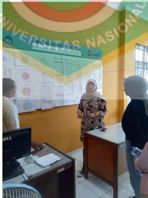
(Pengambilan Data Sekunder di Kelurahan Tegal Gundil)