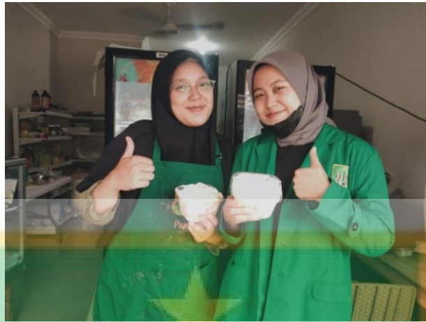
(Pemilik Usaha Salad Buah)